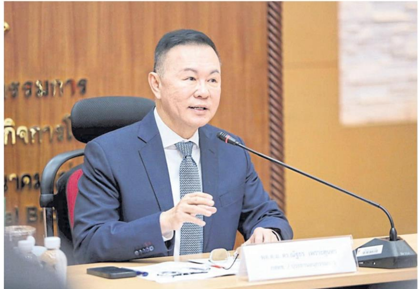
Pol Gen Nathathorn says additional standards are needed for a guideline for telecom operators on the law against cybercrimes.

He said the NBTC set standards for telecom service operators to prevent technology crimes, including measures to prevent new forms of fraud, such as