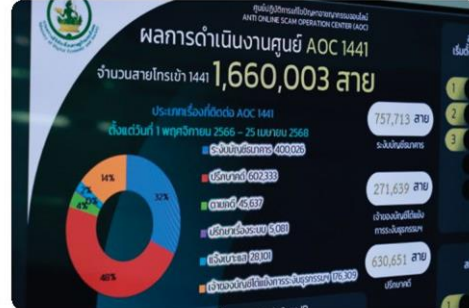
ตัวเลขผลการดำเนินการของศูนย์ AOC 1441 ตลอดระยะเวลาเกือบ 2 ปี

เมื่อวิเคราะห์รูปแบบของคดีที่พบบ่อยที่สุด ยังคงเป็นการหลอกลวงให้ซื้อขายสินค้าและบริการ รองลงมาคือการชักชวนให้โอนเงินโดยอ้างเหตุผลหลากหลาย ตั้งแต่รับงาน รับรางวัล ไปจนถึงการหลอกลวงลงทุนหรือขูดเงิน โดยช่องทางที่มีมิจนาซีฟใช้มากที่สุดยังคงเป็น Facebook ตามด้วยโทรศัพท์จากแก๊งคอลเซ็นเตอร์ เว็บไซต์