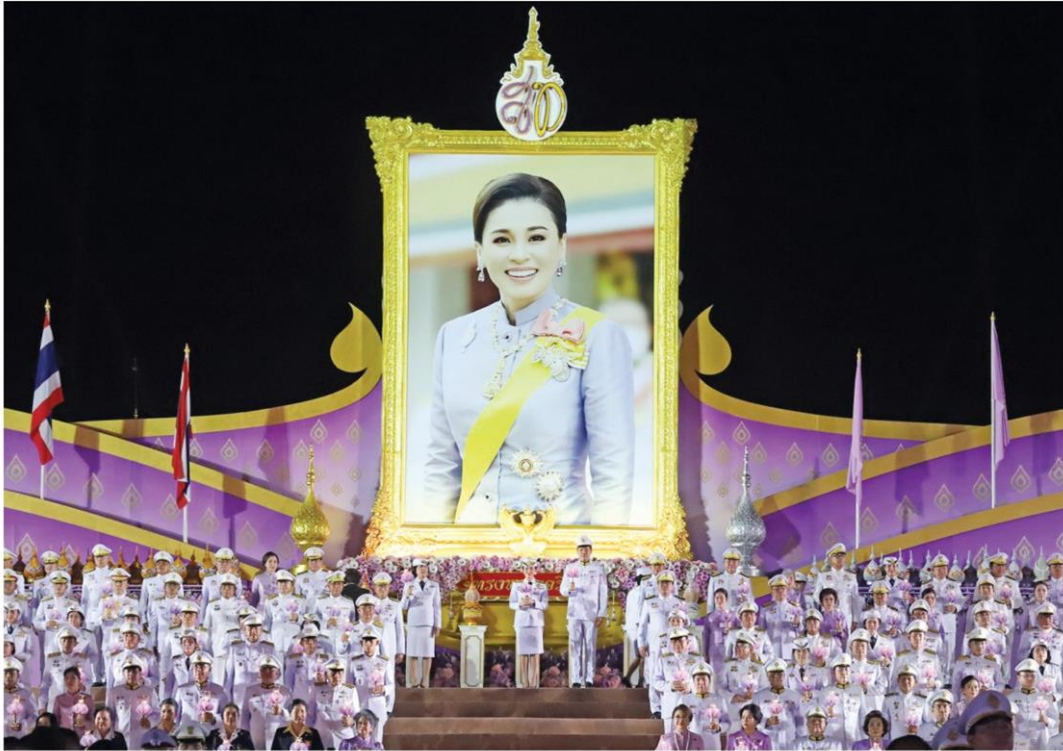
ถวายพระพร - น.ส.แพทองธาร ชินวัตร นายกรัฐมนตรี พร้อมคู่สมรส นำคณะรัฐมนตรี ข้าราชการและประชาชน ร่วมจุดเทียนชัยถวายพระพร เนื่องในวันเฉลิมพระชนมพรรษา สมเด็จพระนางเจ้าฯ พระบรมราชินี ณ มณฑลพิธีท้องสนามหลวง เมื่อวันที่ 3 มิ.ย.

หัวข้อข่าว: พระราชินี เสด็จพิธีวันเฉลิมฯ