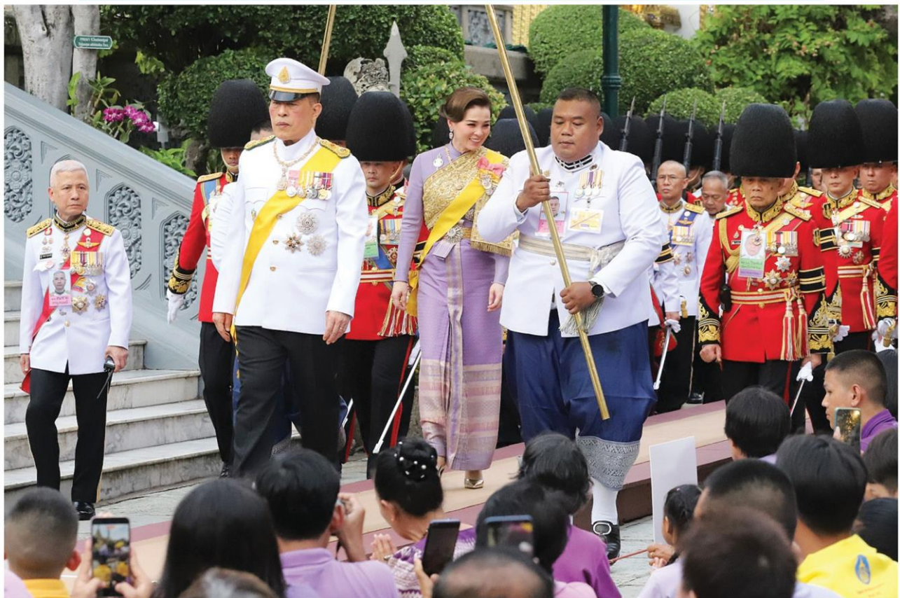
พระบาทสมเด็จพระเจ้าอยู่หัว และสมเด็จพระนางเจ้าสุทิดา พัชรสุธาพิมลลักษณ พระบรมราชินี เสด็จพระราชดำเนินไปในการพระราชพิธีเฉลิมพระชนมพรรษา สมเด็จพระนางเจ้าสุทิดา พัชรสุธาพิมลลักษณ พระบรมราชินี วันที่ 3 มิถุนายน 2568 ณ พระอุโบสถวัดพระศรีรัตนศาสดาราม พระบรมมหาราชวัง เมื่อวันที่ 3 มิ.ย. 2568

‘ในหลวง’และ‘สมเด็จพระราชินี’ เสด็จพระราชดำเนินไปในการพระราชพิธีเฉลิมพระชนมพรรษา □อ่านต่อหน้า 12