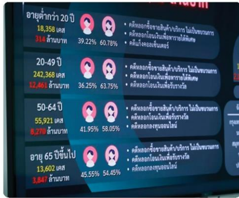
สถิติรูปแบบอาชญากรรมออนไลน์ที่ประชาชนพบ และโทร.มาแจ้งเบาะแส

ระหว่างหน่วยงาน แม้จะยังไม่มีความจำเป็นเร่งด่วนรูปแบบ แต่ด้วยความพยายามอย่างต่อเนื่อง รัฐบาลจึงได้ออก พ.ร.ก. ฉบับที่ 2 ขึ้นมาเมื่อวันที่ 13 เมษายน 2568 เพื่อยกระดับศูนย์ AOC 1441 ให้เป็น ศปอท. หรือ ศูนย์ปฏิบัติการเพื่อป้องกันและปราบปรามอาชญากรรมทางเทคโนโลยี”