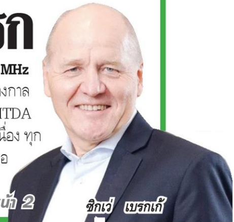
ชิกเว เบรกเก้

นายอนุช せท์กัล หัวหน้าคณะผู้บริหารด้านการเงิน (ร่วม) → → อ่านหน้า 2