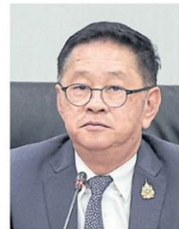
Prasert: New measures in place

The National Broadcasting and Telecommunications Commission (NBTC) has been assigned to investigate service providers involved in IO activities and report to the committee.