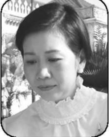
รัชดา ธนาดิเรก

แม้เทศกาลสงกรานต์จะจบลงไปแล้ว แต่ก็เหมือน “โฆษกรัฐบาล” อย่าง “รัชดา ธนาดิเรก” บอกนั้นแล้ว สงกรานต์ไทยกลายเป็นมรดกโลก หรือเป็นเว็ลต์ฮีเวนต์ไปแล้ว เพราะมันสะท้อนพลังวัฒนธรรมของคนในวิถีเอเชียที่จะอยู่ริมน้ำมานับพันปี รวมทั้งยังดึงดูดความสนใจจากคนทั่วโลกที่ใครก็ไม่สามารถเคลมได้ โดย “การท่องเที่ยวแห่งประเทศไทย (ททท.)” ได้คาดการณ์ภาพรวมการเดินทางท่องเที่ยว