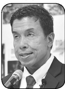
ชัชชาติ สิทธิพันธุ์

หัวร้างข้างแตกและถึงชีวิตกันได้...● หันมาดูความเคลื่อนไหวของนายฯ หนูกันบ้าง เพราะเมื่อวันพุธ “อนุทิน ชาญวีรกูล” นายฯ และ รมว.มหาดไทย ได้เดินทางเข้าทำเนียบรัฐบาล เพื่อเข้าร่วมประชุมทางไกลในการประชุมประชาคมเอเชียเพื่อการปล่อยก๊าซเรือนกระจกเป็นศูนย์ หรือ AZEC ซึ่งหลังประชุมเสร็จก็ได้ให้สัมภาษณ์แบบยาวๆ ครั้งแรกในสัปดาห์ และเจ้าตัวก็บอกว่าต่อไปอาจแค่สัปดาห์ละครั้งเท่านั้นแหลม! เรียกว่าเล่นบทเดมี่ไว้จนติดใจกันไปแล้วแน่นอน...● ที่น่าสนใจในการให้สัมภาษณ์ของ “นายฯ อนุทิน” คือการแย้มถึงโครงการคนละครึ่งพลัสว่าจะทำให้เร็วที่สุด เพราะรัฐบาลเพิ่งบริหารราชการแผ่นดินได้เต็มรูปแบบเมื่อวันที่ 10 เม.ย. พร้อมระบุว่า น่าจะพลัสมากกว่าคนละครึ่งครั้งที่แล้ว รวมทั้งยังมีมาตรการช่วยเหลือเรื่องค่าไฟ 200 หน่วยแรก ไม่ให้เกินหน่วยละ 3 บาทที่ให้แก่ทุกกลุ่ม ส่วนใครใช้ไฟเกินก็คิดราคาตามขั้นบันได รวมถึงมาตรการสินค้าไทยช่วยไทย พร้อมทั้งมองแง่ดีที่ “เจ้าใหม่” ศิริกัญญา ตันสกุล สส.บัญชีรายชื่อ และรองหัวหน้าพรรคประชาชน เห็นด้วยในโครงการคนละครึ่งพลัสว่าเป็นเรื่องปกติ เขาต้องทำหน้าที่ท้วงติง แต่ก็เหมือนที่ “วิมล ไทรนิมมล” นักเขียนรางวัลซีไรต์ชื่อดัง โพสต์ศกกราฟิกท้วงติงนั่นแหละว่า นี่หรือพรรครักประชาชน เพราะด้านทุกอย่าง แต่ที่ เรื่องอาหารฟรีจากเงินภาษีมีมูลค่า 1,000 บาท และเงิน