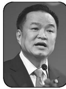
อนุทิน ชาญวีรกูล

หัวร้างข้างแตกและถึงชีวิตกันได้...● หันมาดูความเคลื่อนไหวของนายฯ หนูกันบ้าง เพราะเมื่อวันพุธ “อนุทิน ชาญวีรกูล” นายฯ และ รมว.มหาดไทย ได้เดินทางเข้าทำเนียบรัฐบาล เพื่อเข้าร่วมประชุมทางไกลในการประชุมประชาคมเอเชียเพื่อการปล่อยก๊าซเรือนกระจกเป็นศูนย์ หรือ AZEC ซึ่งหลังประชุมเสร็จก็ได้ให้สัมภาษณ์แบบยาวๆ ครั้งแรกในสัปดาห์ และเจ้าตัวก็บอกว่าต่อไปอาจแค่สัปดาห์ละครั้งเท่านั้นแหลม! เรียกว่าเล่นบทเดมี่ไว้จนติดใจกันไปแล้วแน่นอน...● ที่น่าสนใจในการให้สัมภาษณ์ของ “นายฯ อนุทิน” คือการแย้มถึงโครงการคนละครึ่งพลัสว่าจะทำให้เร็วที่สุด เพราะรัฐบาลเพิ่งบริหารราชการแผ่นดินได้เต็มรูปแบบเมื่อวันที่ 10 เม.ย. พร้อมระบุว่า น่าจะพลัสมากกว่าคนละครึ่งครั้งที่แล้ว รวมทั้งยังมีมาตรการช่วยเหลือเรื่องค่าไฟ 200 หน่วยแรก ไม่ให้เกินหน่วยละ 3 บาทที่ให้แก่ทุกกลุ่ม ส่วนใครใช้ไฟเกินก็คิดราคาตามขั้นบันได รวมถึงมาตรการสินค้าไทยช่วยไทย พร้อมทั้งมองแง่ดีที่ “เจ้าใหม่” ศิริกัญญา ตันสกุล สส.บัญชีรายชื่อ และรองหัวหน้าพรรคประชาชน เห็นด้วยในโครงการคนละครึ่งพลัสว่าเป็นเรื่องปกติ เขาต้องทำหน้าที่ท้วงติง แต่ก็เหมือนที่ “วิมล ไทรนิมมล” นักเขียนรางวัลซีไรต์ชื่อดัง โพสต์ศกกราฟิกท้วงติงนั่นแหละว่า นี่หรือพรรครักประชาชน เพราะด้านทุกอย่าง แต่ที่ เรื่องอาหารฟรีจากเงินภาษีมีมูลค่า 1,000 บาท และเงิน