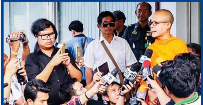
■ รับทราบข้อหา ■ พระวิเทศกาวนาจารย์ รักษาการเจ้าอาวาสวัดพระธรรมกาย มารับทราบข้อกล่าวหาให้ที่พักพิงแก่ผู้ต้องหา ก่อนได้ประกันตัวท่ามกลางบรรดาศิษย์มาให้กำลังใจแน่น ที่ สภ.คลองหลวง จ.ปทุมธานี เมื่อวันที่ 26 ธ.ค.

ให้ตั้งแต่วันที่ 13-16 ธันวาคม เนื่องจากเกรงว่าจะเกิดเหตุการณ์บานปลาย จากการที่พระสงฆ์และเหล่าศิษยานุศิษย์ของวัดพระธรรมกายเข้ามาชุมนุมภายในวัดจำนวนมาก ทำให้ดีเอสไอต้องหันไปแจ้งข้อกล่าวหากรรมการเจ้าอาวาสวัดพระธรรมกาย ในฐานะที่พักพิงแก่ผู้ต้องหาแทน