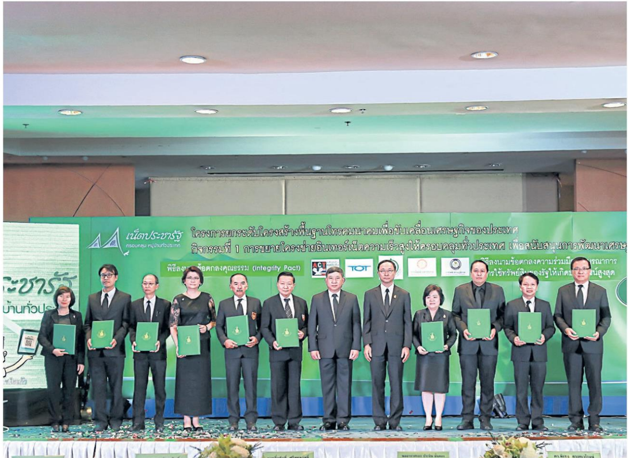
คิกออฟ : พล.อ.ประจิน จั่นตอง รองนายกรัฐมนตรี และ พิเชฐ ดุรงคเวโรจน์ รัฐมนตรีว่าการกระทรวงดิจิทัลเพื่อเศรษฐกิจและสังคม (ดีอี) ร่วมเป็นประธานพิธีเปิดโครงการยกระดับโครงสร้างพื้นฐานโทรคมนาคมเพื่อขับเคลื่อนเศรษฐกิจของประเทศ กิจกรรมที่ 1 การขยายโครงข่ายอินเทอร์เน็ตความเร็วสูงให้ครอบคลุมทั่วประเทศ เมื่อ 26 ธ.ค. 2559 ที่ผ่านมา