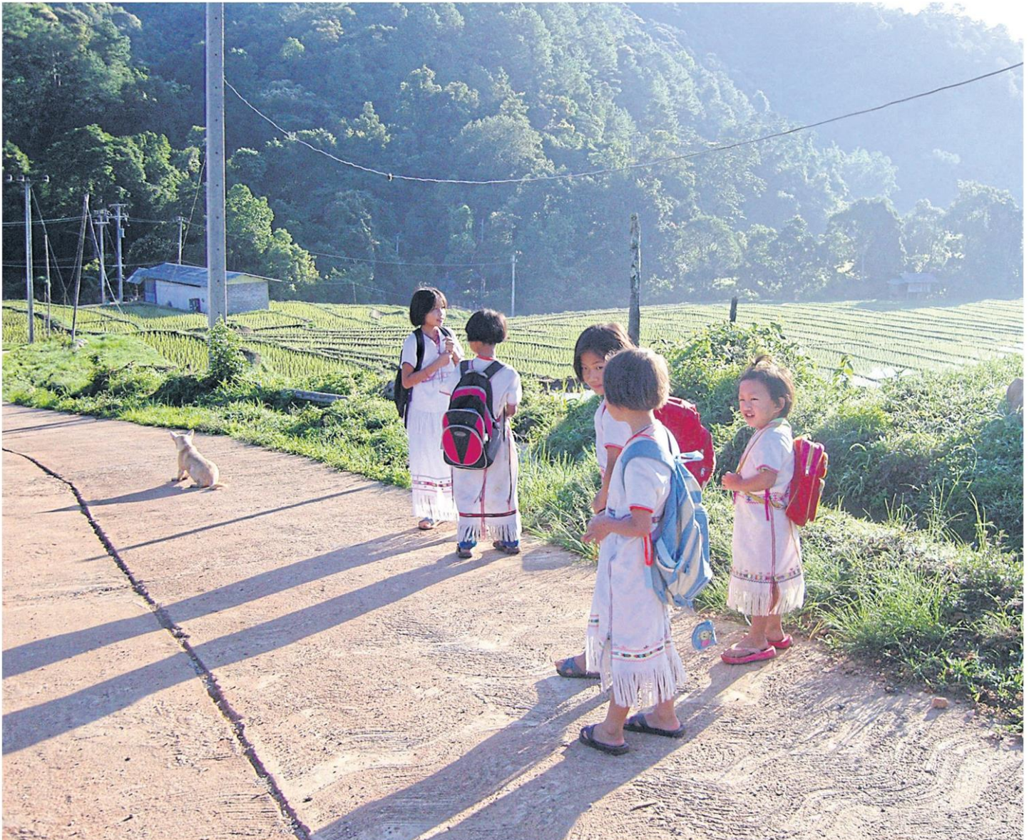
Karen children are on the way to school. The government’s affordable internet service is expected to be available in rural area nationwide next year.

“The national broadband project is part of the government’s policy to create