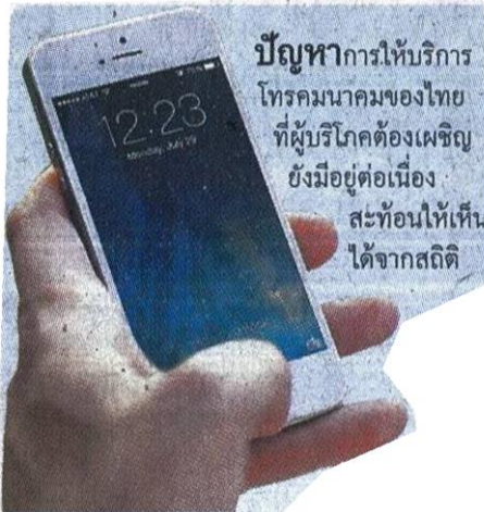
ปัญหาการให้บริการโทรคมนาคมของไทยที่ผู้บริโภคต้องเผชิญยังมีอยู่ต่อเนื่องสะท้อนให้เห็นได้จากสถิติ