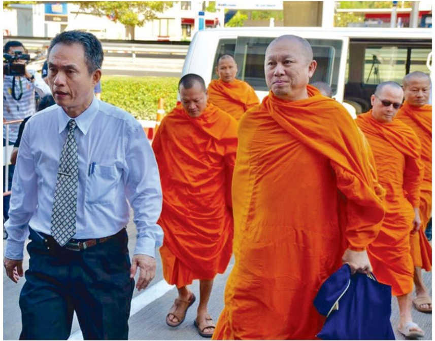
รับข้อหา - พระวิเทศภานาจารย์ รักษา การแทนเจ้าอาวาสวัดพระธรรมกาย เข้ารับทราบ ข้อกล่าวหาให้ที่พักพิงพระธัมมชโย และอื่นๆ รวม 19 ข้อหา ดร.สอบปากคำนาน 7 ชม. ก่อนปล่อย ตัว ที่สภ.คลองหลวง จ.ปทุมธานี เมื่อ 26 ธ.ค.