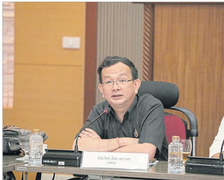
เปิดประชุม : ประวิทย์ ลีสถาพรวงศา กรรมการกิจการกระจายเสียง กิจการโทรทัศน์ และ กิจการโทรคมนาคมแห่งชาติ (กสทช.) เปิดการประชุม NBTC Public Forum ครั้งที่ 2/2560 เรื่องอนาคตเพย์ทีวี 4.0 กับสิทธิผู้บริโภค ณ อาคารหอประชุม ชั้น 2 สำนักงาน กสทช.