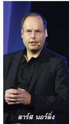
ลาร์ส นอร์ลิ่ง