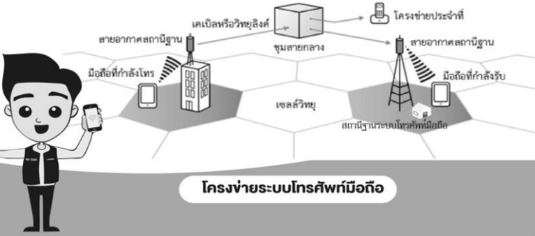
โครงข่ายระบบโทรศัพท์มือถือ

คลื่นจากเสาส่งสัญญาณมือถือ ไม่เป็นภัยอย่างที่คิด กสทช. กำกับดูแลเป็นนิตย เพื่อความสบายใจ