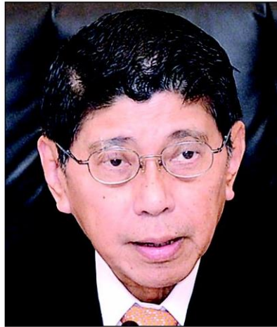
วิญญู เครื่องาม

ก็ต้องเข้ารัฐอยู่ดี ไว้ใจกันบ้าง แล้วถ้าไม่ใช่มาตรา 44 เราจะทำอย่างไรกัน ในเมื่อซิมจะดับวันที่ 14 เมษายนแล้ว คนก็เดือดร้อนแล้วผมก็โดนอยู่ดี นึกถึงคนอื่นเขาบ้างสิ ส่วนเรื่องผลประโยชน์จะเป็นของใครผมไม่รู้ เพราะผลประโยชน์อยู่กับชาติ ประมูลมาเงินก็เข้าชาติ ไม่ได้เข้ากระเป๋าผม ที่สำคัญเรามีเรื่องต้องทำเยอะแยะที่ต้องใช้เงิน” พล.อ.ประยุทธ์กล่าว