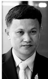
นที สุกครัตน์

กตปุมนำร่องแจกไปแล้ว 5.5 หมื่นเครื่อง ใน 8 จังหวัด หากมีปัญหาใครจะรับผิดชอบ... ● และที่อดสงสัยไม่ได้คือ ทีไออาร์ ที่ระบุไว้ว่าการสุ่มตรวจจะต้องมีเครื่องเสียได้ไม่เกิน 7 เครื่อง ถ้าหากมากกว่านั้น ทางไอซีทีจะส่งคืนบริษัท เสิ่นเงิน สโคป เพื่อนำไปปรับปรุง ถ้าจะให้ดีไม่ควรมีเครื่องเสียเลยจะดีกว่ามัยท่าน น.อ.อนุดิษฐ์ นัครทรพรพ รมว.ไอซีที เพราะขนาดสุ่มตรวจยังไม่ผ่าน... ● พ.อ.นที สุกครัตน์ รองประธานคณะกรรมการกิจการกระจายเสียง กิจการโทรทัศน์ และกิจการโทรคมนาคมแห่งชาติ (กสทช.) และประธานคณะกรรมการกิจการกระจายเสียงและ