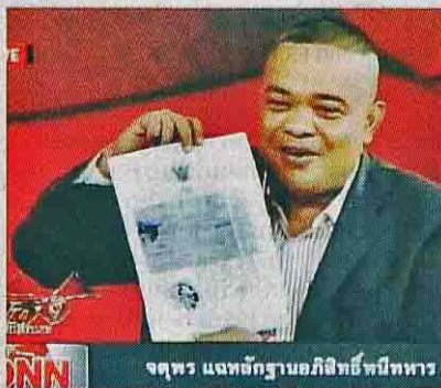
FORMER PHEU THAI MP and red-shirt leader Jatuporn Promphan during 'Choo Thong', a show that is broadcast on Asia Update channel daily.