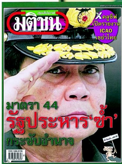
Section 44 as a recoup is Matichon Weekly's cover story.