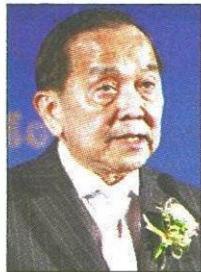
พล.อ.อ.ชเรศ ปุณศรี

หัวข้อข่าว: "บอร์ด ดีอี"จ่อยึดคลื่นอสมทย่าน"2.3-2.6GHz"มาจัดสรรใหม่