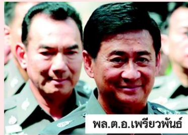
พล.ต.อ.เพรียวพันธ์

2. ด้านการดูแลความสงบเรียบร้อย ปฏิบัติงานของเจ้าหน้าที่ตำรวจภายใต้การนำของ พล.ต.ต.คำรณวิทย์ ธูปกระจ่าง ปฏิบัติราชการแทน ผบ.ชน. โดยเตรียมกำลังตำรวจ 400 กองร้อย แต่ที่น่าสนใจมากกว่านั้น พล.ต.อ.เพรียวพันธ์ ดามาพงศ์ ผู้บัญชาการตำรวจแห่งชาติ (ผบ.ตร.) มีคำสั่งมอบหมายให้ พล.ต.อ.อดุลย์ แสงสิงแก้ว รอง ผบ.ตร. ที่มีตำแหน่งเลขาธิการ ป.ป.ส.อีกตำแหน่ง มารับผิดชอบงานด้านความมั่นคง และเป็นผู้บังคับบัญชาสูงสุด จากเดิมที่ให้ทำหน้าที่