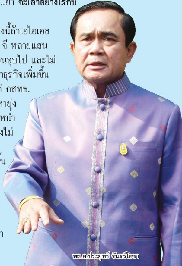
พล.อ.ประยุทธ์ จันทร์โอชา

●●...เพราะเรื่องนี้ถ้าเอไอเอส ไม่เสียดายลูกค้า 2 จี หลายแสน หมายเลขจะถูกเพื่อนซุบไป และไม่ คิดที่จะเอาไปพัฒนาธุรกิจเพิ่มขึ้น ข้อเสนอพิเศษให้แก่ กสทช. ก็คงจะไม่เกิด ปัญหายุ่ง ยากวุ่นวายก็จะกระหน่ำ ใส่ กสทช. สภาพคงไม่ ต่างอะไรกับลิงแก่ แห่ คำถามจะเกิดขึ้น มากมายมหาศาล โดยเฉพาะเรื่อง ของความเป็นธรรม ที่อย่างน้อยๆ ค่าย ทรูมูฟ ก็ต้องถามหา มาแน่