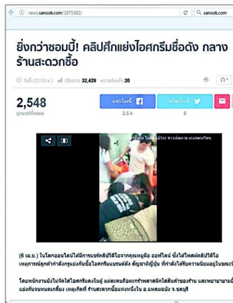
A video clip showing people scrambling to grab Glico ice cream at a Pattaya convenience store.

"It's about time tourism police or guards are sent to keep order," the user suggested.