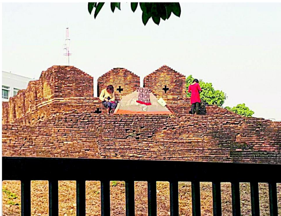
Chiang Mai residents are urging authorities to exercise stricter control on tourists after two were found to have camped out on the city's wall.