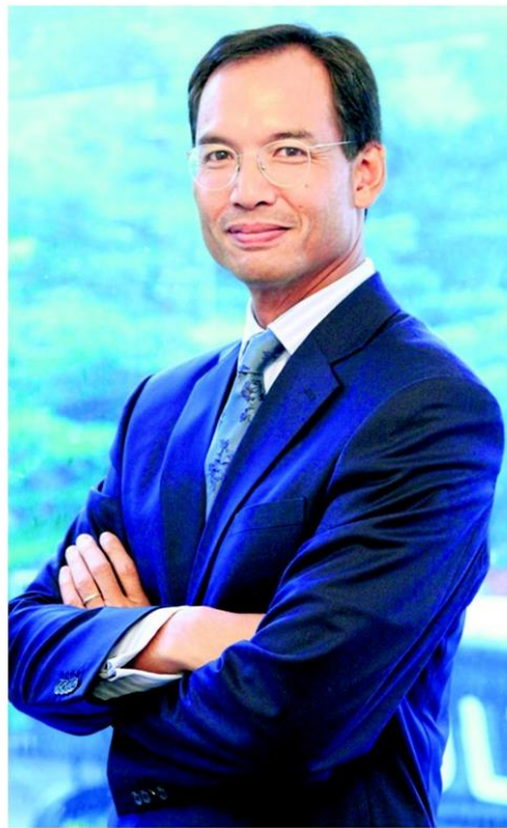
Former finance minister Korn Chatikavanij is warning state agencies against relying too much on Section 44 after the NBTC asked PM Gen Prayut Chan-o-cha to exercise his powers under the interim charter in the 4G spectrum saga.

"This made me feel that our state agencies are increasingly addicted to special power," Mr Korn wrote. "Without Section 44, they seem unable to get anything done. I feel tired for the PM," he said.