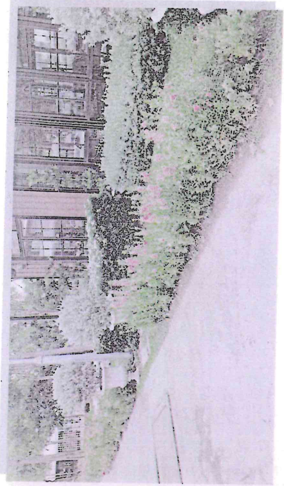
พื้นที่สีแดง คือพื้นที่ปรับเปลี่ยนพื้นที่ไม้และจัดสวนตามฤดูกาล ภาพประกอบ