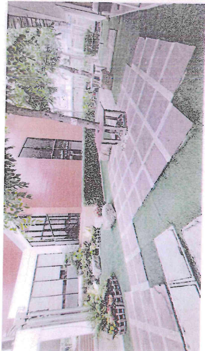
พื้นที่สีเขียว คือพื้นที่จัดสวนพื้นที่ไม้ พื้นที่น้ำตก ภาพประกอบ