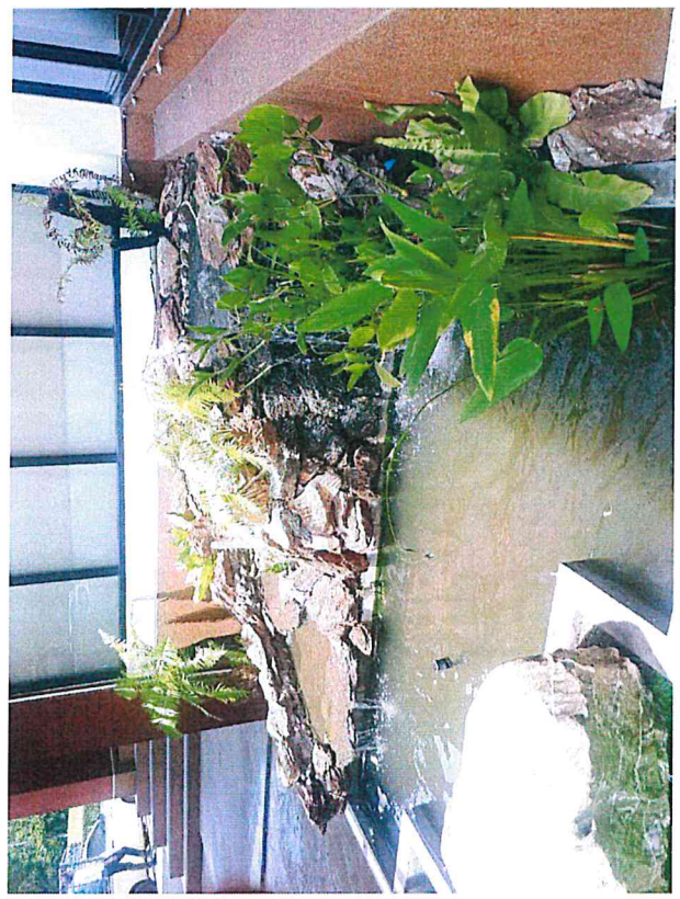
พื้นที่สีเขียว คือพื้นที่จัดสวนพันธุ์ไม้พุ่มที่นำตก ภาพประกอบ