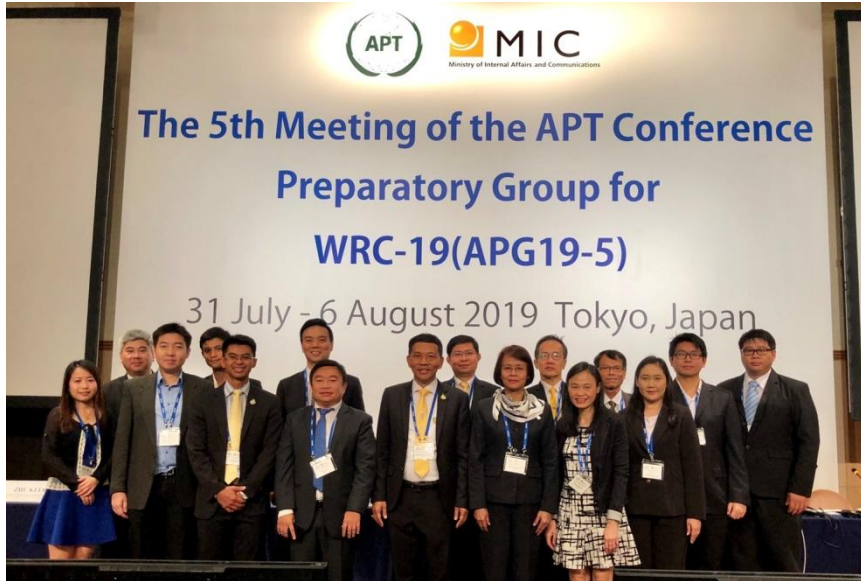
คณะผู้แทนไทย จำนวน 19 คน