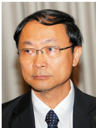
พิเชฐ ดุรงคเวโรจน์

นายพิเชฐ ดุรงคเวโรจน์ รัฐมนตรีว่าการกระทรวงดิจิทัลเพื่อเศรษฐกิจและสังคม (ดีอี) เปิดเผย “ประชาชาติธุรกิจ” ว่า แผนการตั้งกองทุนโครงสร้างพื้นฐาน 1.5 หมื่นล้านบาท ที่เดิมกำหนดให้เงินงานเร่งด่วนของกระทรวงดีอีที่ต้องเร่งผลักดันให้เกิดขึ้นภายในปีนี้ โดยจะนำโครงข่ายเน็ตประชารัฐเข้าเป็นทรัพย์สินประเดิมกองทุนนั้น กระทรวงดีอีตัดสินใจว่าจะไม่ผลักดันอีกต่อไป แต่จะปล่อยให้เป็นเรื่องที่ “NBN co.” บริษัทโครงข่ายภายในประเทศ ซึ่งเป็นบริษัทร่วมทุนระหว่าง บมจ.ทีโอที และ บมจ.กสท โทรคมนาคมตัดสินใจ เนื่องจากจะนำทรัพย์สินที่เป็นโครงข่ายบรรดแบนด์ภายในประเทศมาจัดตั้งขึ้นตามนโยบายคณะกรรมการนโยบายรัฐวิสาหกิจ (คนร.) สอดคล้องกับผลการศึกษาแผนพัฒนาโครงข่ายสื่อสารบรรดแบนด์แห่งชาติที่กระทรวงดีอีทำขึ้น และพบว่าเป็นแนวทางบริหารจัดการโครงสร้างพื้นฐานด้านโทรคมนาคมของประเทศที่มีประสิทธิภาพ