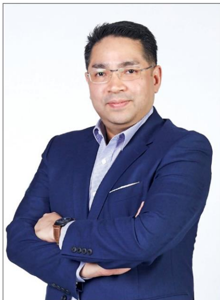
△ ตามพ์ นานา

ผู้ประกอบการทีวีดิจิทัลช่องต่างๆ มากขึ้น โดยเฉพาะผลิตภัณฑ์ที่ต้องการเจาะกลุ่มผู้บริโภคที่มีเซ็กเมนต์ที่ชัดเจน