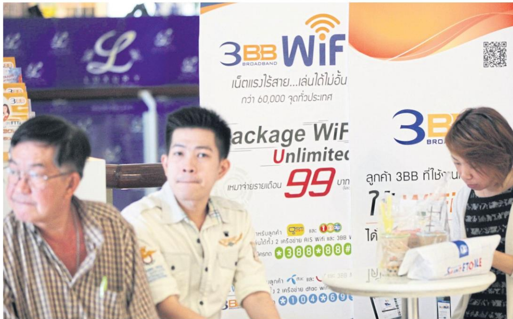
A display describes a promotional package offered by 3BB. The company is one of four big players in the fixed broadband service market.