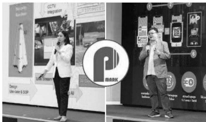
ผู้ประกอบการนำเสนอผลงานนวัตกรรมหุ่นยนต์บริการและ IoT

P-mark เป็นตราสัญลักษณ์ออกให้โดยองค์กรที่ได้รับการยอมรับในระดับสากล และหน่วยงานควบคุมมาตรฐานผลิตภัณฑ์ในประเทศ เช่น สำนักงานคณะกรรมการกิจการกระจายเสียง กิจการโทรทัศน์และกิจการโทรคมนาคมแห่งชาติ (กสทช.) สำนักงานมาตรฐานผลิตภัณฑ์อุตสาหกรรม (สมอ.) รวมถึงหน่วยงานมาตรฐานอื่นๆ ทั้งในประเทศและต่างประเทศ