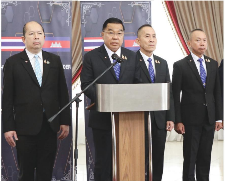
🏠 แถลงจีบีซี - พล.อ.ฉัตรพล นาคพาณิชย์ รมว.กลาโหม แถลงผลสำเร็จภายหลังการประชุม คณะกรรมการชายแดนทั่วไปไทย-กัมพูชา ที่มาเลเซีย ระบุกัมพูชายอมรับข้อเสนอ 4 ข้อ ถอนอาวุธหนัก เก็บกู้ทุ่นระเบิด ปราบไซเบอร์สแกม และจัดระเบียบชายแดน เมื่อวันที่ 23 ต.ค.

ส่วนขั้นตอนภายหลังจากการลงนาม ประกาศความสัมพันธ์ไทย-กัมพูชา เสร็จสิ้นนั้น ในการลงนามประกาศ ความสัมพันธ์ จะมีแผนดำเนินการ แนบว่า หลังจากนี้จะต้องมีการถอน อาวุธหนัก การเก็บกู้ทุ่นระเบิด รวมถึง