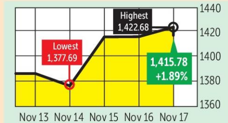
* From the previous week BANGKOK POST GRAPHICS

stable, saying the US economy is strong and the Treasury market is both safe and liquid. Moody's flagged a significant budget deficit and a substantial reduction in debt repayment capacity.