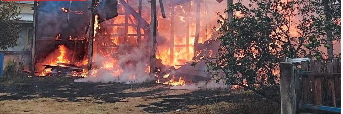
▷ โดนถล่มหนัก สภาพบ้านราษฎรในชุมชน อ.โคกสูง จ.สระแก้ว ถูกอาวุธหนักจากฝั่งกัมพูชายิงมั่วเข้ามา จนไฟไหม้วอดทั้งหลัง ขณะที่ ส.อ.กัมปนาททองแสง (ภาพเล็ก) สละชีพจากการปฏิบัติหน้าที่ ณ สมรภูมิม้านคลองแวง อ.ตาพระยา นับเป็นการสูญเสียกำลังพลรายที่ 22 ในการปะทะรอบใหม่นี้

แตกตื่น บางส่วนเร่งอพยพออกจากพื้นที่ใกล้แนวชายแดน