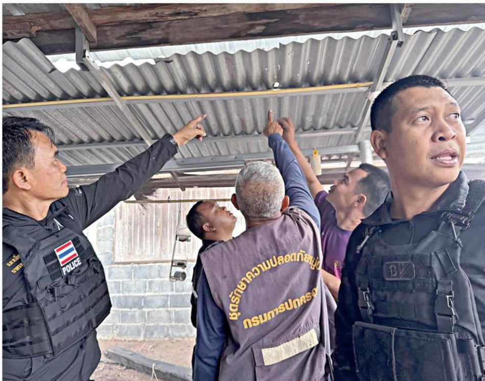
◀ พังและ...สภาพบ้านเรือนประชาชนใน จ.สระแก้ว ที่พังเสียหายยับ หลังทหารกัมพูชาระดมยิงปืนใหญ่ตกใส่ โดยทหารทั้ง 2 ฝ่ายสู้รบกันอย่างดุเดือดใน 4 อำเภอ ส่งผลให้ชาวบ้านที่ตกค้างต้องเร่งอพยพหนีตายออกจากพื้นที่อย่างเร่งด่วน

ขณะที่กองทัพภาคที่ 1 เผยแพร่ข้อความแสดงความเสียใจอย่างสุดซึ้งต่อครอบครัว ส.อ.กัมปนาท ทองแสง สังกัดกองพันทหารราบที่ 1 กรมทหารราบที่ 21 รักษาพระองค์ เสียชีวิตจากการปฏิบัติหน้าที่ปกป้องอธิปไตยของชาติ ในพื้นที่ชายแดนไทย-กัมพูชา บ้านคลองแฝง อ.ตาพระยา