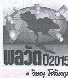
• วิทย์ เทคโนโลยี

ถือเป็นข่าวดี สำหรับคนที่ต้องการใช้คลื่นสื่อสารเชิงพาณิชย์ที่ทันโลกเพราะรอคอยมานานหลายปี ทั้งที่เพื่อนบ้านไทย (ไม่นับเมียนมาร์) ใช้เทคโนโลยีดังกล่าวไปกันหมดแล้ว