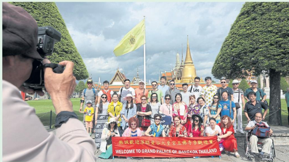
Chinese tourists pose for a picture at the Grand Palace. China has been the main driver of Thailand's tourism industry in the past few years. PATIPAT JANTHONG

of 2014 to restore confidence among foreign tourists and burnish the country's tarnished image, with some foreigners viewing the country as unsafe to visit. Measures spanned from organising a series of international road shows to providing information to the international community, stepping up safety measures