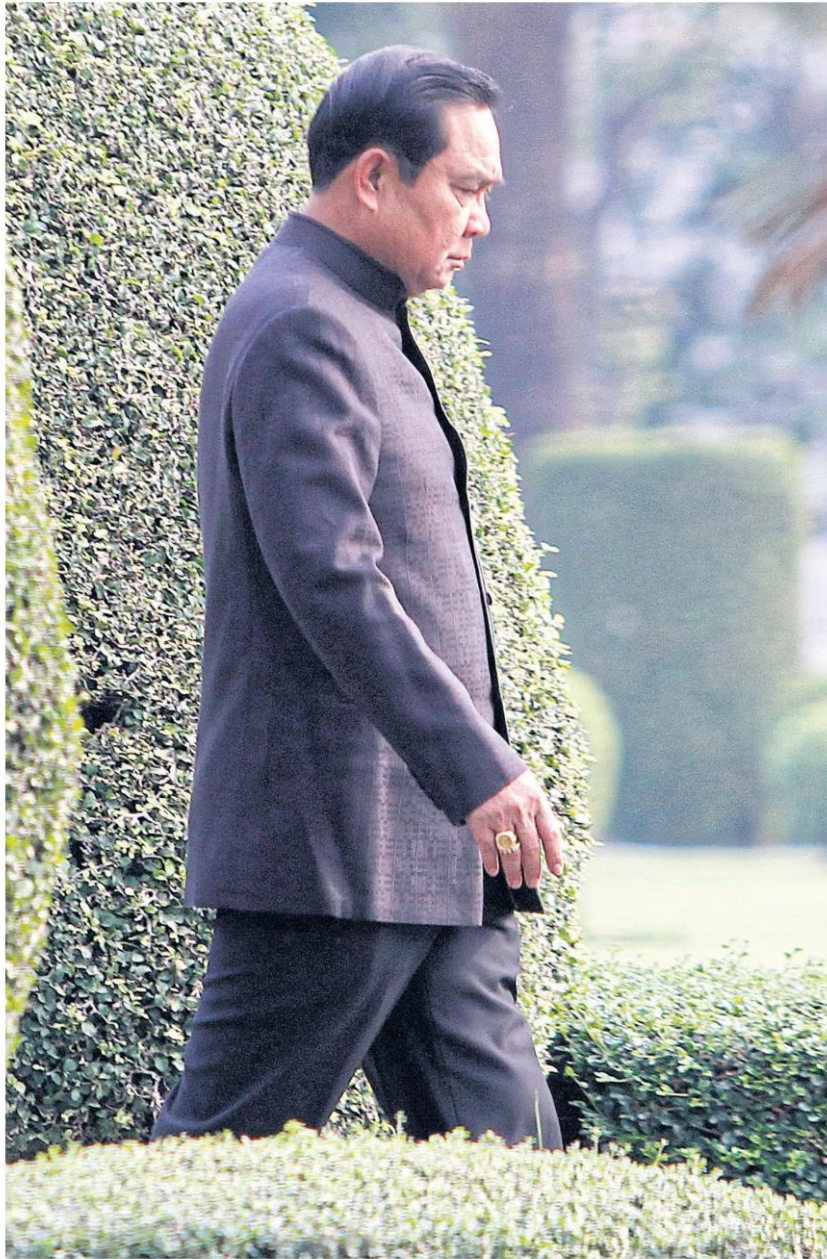
The military government of Prime Minister Prayut Chan-o-cha has managed to restart the economy, which had stalled under the Yingluck administration. THANARAK KHUNTON

The EEC development plan (2017-21) calls for 48 development projects with an investment value of 6.99 billion baht. These projects are mostly undergoing feasibility studies and environmental impact assessments this year.