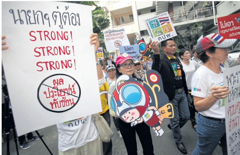
Protesters march against the new energy bill. A policy to restructure energy prices was one of NCPO's challenges. THANARAK KHUNTON