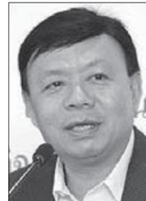
ฐากร ตัณฑสิทธิ์

GOOGLE ไทย-LINE ไทย นั่นเอง .. ฐากร ตัณฑสิทธิ์ เลขาธิการ กสทช. ที่ร่วมคณะไปมอสโคว์ ด้วย สาธยายว่าทางรัสเซียเสนอตัวช่วยพัฒนา “แพลตฟอร์ม” ให้กับประเทศไทย โดยรัสเซียถือหุ้น 49% ไทยถือหุ้น 51% โดย กสทช. หวังว่าจะเป็นการอุดช่องโหว่ที่ไม่สามารถจัดเก็บรายได้ของ “ผู้ประกอบการแพลตฟอร์มต่างๆ” ที่ให้บริการในประเทศไทย .. ส่วนงบประมาณก็แค่ 1.2 พันล้านบาทต่อปี สหรัฐ หรือประมาณ 4.2 หมื่นล้านบาท เท่านั้น จ๊็บๆ