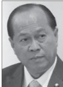
พล.อ.อนุพงษ์ เผ่าจินดา