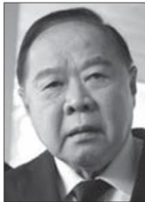
พล.อ.ประวิตร วงษ์สุวรรณ