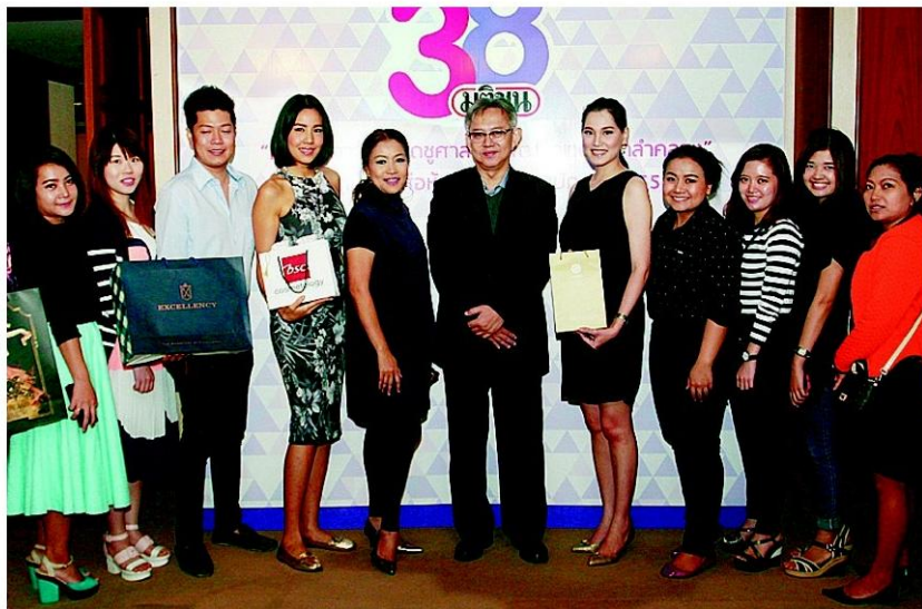
เครือข่ายพันธมิตร ร่วมแสดงความยินดี