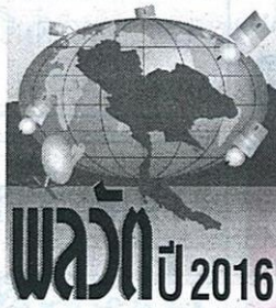
• วิชาญ ไชยศิลป์

ตั้งต้นประมูล 75,654 ล้านบาท หรือคิดเป็นเงิน 3,783 ล้านบาท เป็นแบงก์การันตี แต่คงเงื่อนไขการชำระเงินค่าประมูลเหมือนเดิม คือจ่าย 4 งวด โดยปีแรก จ่าย 8,040 ล้านบาท ปีที่ 2 จ่าย 4,020 ล้านบาท ปีที่ 3 จ่าย 4,020 ล้านบาท และปีที่ 4 จ่ายส่วนที่เหลือ