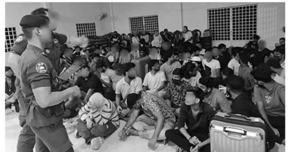
เหยื่อแก๊งคอลฯปอยเปตรอดคัดกรองก่อนส่งกลับ ปท.