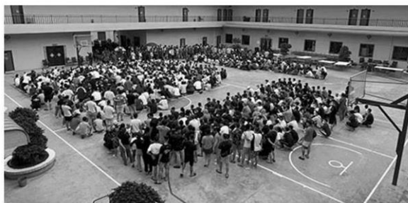
เหยื่อแก๊งคอลเซ็นเตอร์ ถูกช่วยจากเมืองเมียวดี

พล.ต.อ.รัชชชัยเปิดเผยว่า ในการประชุมวางแผนการปฏิบัติ ได้ข้อสรุปทั้งหมด 3 ข้อ ได้แก่ 1.ร่วมกันปราบปรามแก๊งคอลเซ็นเตอร์ให้หมดไป โดยมีเป้าหมายเข้าไปกวาดล้าง ตรวจสอบจับกุม ในจุดต่างๆ ที่เป็นที่ตั้งของแก๊ง โดยทางตำรวจไทย ขอนำตัวคนไทยกลับมาลงโทษตามกฎหมายที่ประเทศไทย 2.ร่วมกันช่วยเหลือคนไทยที่ตกเป็นเหยื่อค้ำมนุษย์ ให้กลับคืนสู่ครอบครัวอย่างรวดเร็ว และ 3.จัดตั้งศูนย์ประสานงานร่วมระหว่างไทย-กัมพูชา เพื่อความรวดเร็วในการปราบปรามแก๊งคอลเซ็นเตอร์ให้หมดไป