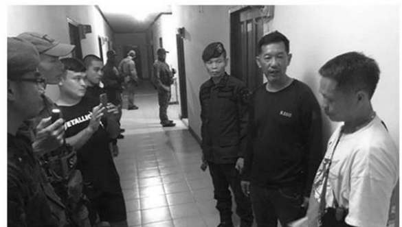
ตร.ภาค2จับกุมโรงแรมเถื่อน ให้ที่พักเหล่าบัญชีม้า รอข้ามไปสแกนหน้าถอนเงิน

ถึ มว่าวันที่ 22 กุมภาพันธ์ ก็มีรายงานข่าวว่า เจ้าหน้าที่กัมพูชานุกเข้าไปช่วยเหลือแก๊งคอลเซ็นเตอร์ บนตึกสีฟ้าสูง 4 ชั้น ตั้งอยู่ในพื้นที่ฝั่งปอยเปต ใน จ.บันเตียเมียนเจย ประเทศกัมพูชา ได้ทั้งหมด 227 คน แบ่งเป็นหญิง 60 ชาย 65 คน คัดกรองเบื้องต้นเป็นชาวอินโดนีเซีย 3 คน ชาวอินเดีย 48 คน และชาวปากีสถาน 51 คน ส่วนที่เหลืออีกร้อยกว่าคนเป็นคนไทย โดยก่อนหน้านี้ทางตำรวจไทยได้ รับการประสานงานมาจากเหยื่อแก๊งคอลเซ็นเตอร์ที่ทำงานอยู่บนตึกดังกล่าว มีการแอบส่งข้อความ และคลิปวิดีโอขอความช่วยเหลือมา จนสามารถสืบทราบถึงแหล่งกบดานของ