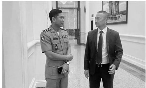
พล.ต.อ.รัชชัย ปิตะนีละบุตร จเรตำรวจแห่งชาติ เดินทางไป ประสานตำรวจกัมพูชา เพื่อจับกุมแก๊งคอลฯปอยเปต