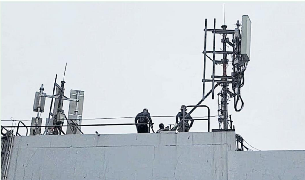
The NBTC and joint operations team inspect suspicious telecom equipment located on the roof of a building in Nong Khai.

TRAI RAT VIRIYASIRIKUL Acting secretary-general, NBTC