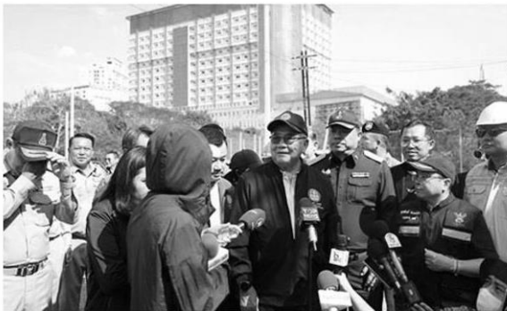
นายภูมิธรรม เวชยชัย รองนายกรัฐมนตรีและ รมว.กลาโหม ลงพื้นที่ อ.อรัญประเทศ