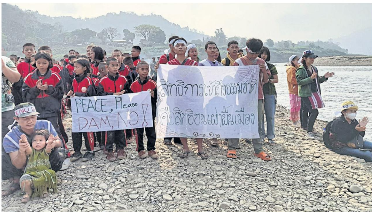
Indigenous villagers in Tak province protest on March 13, 2023, against a government mega-project to divert water from rivers in the North to increase the water volume in the Bhumibol Dam in Tak province and the Hat Gyi Dam in Myanmar.

For generations, indigenous communities — hill tribes, Moken sea nomads, forest dwellers — have been branded as squatters, evicted, and jailed. They've faced violence and