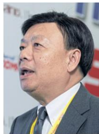
Takorn: NBTC cannot make AIS decision

AIS said it needed only two months to pay for the licence.