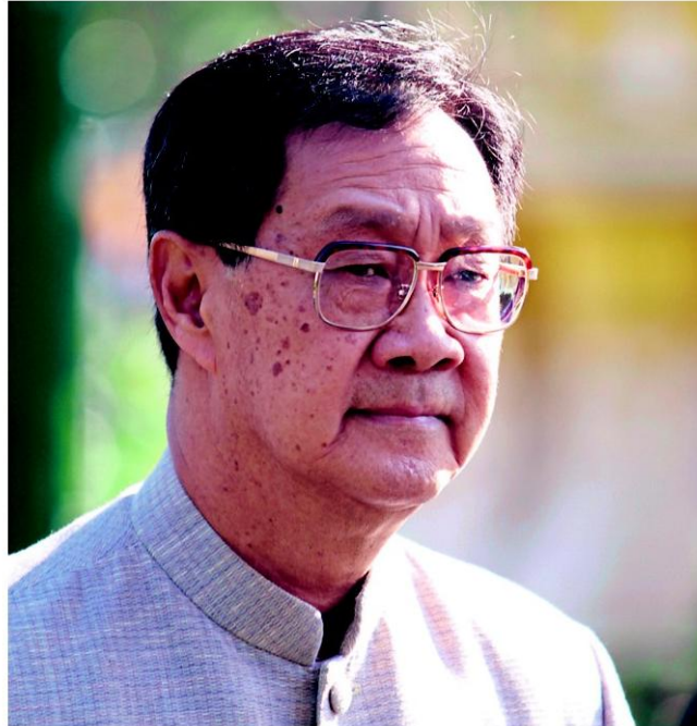
MR Pridiyathorn Devakula

D hanin Chearavanont once proudly said, "Raw materials, talented people and money belong to Charoen Pokphand Group," an empire founded by himself.