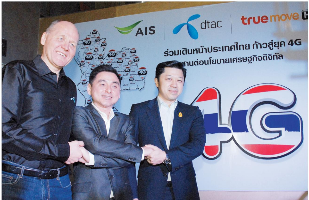
ประสานเสียง - ซีโอโอ 3 ยักษ์มือถือส่งท้ายปีด้วยการขึ้นเวทีร่วมด้วยช่วยกันประกาศ จุดยืนที่ต้องการเห็นการประมูลคลื่นใหม่เพื่อนำไปพัฒนาบริการ 4G ในปีหน้า

“เมื่อมีการประมูลคลื่นทั้งสองช่วง เอกชน ที่ได้คลื่นไปจะต้องลงทุนสร้างโครงข่าย จุดนี้ภาครัฐจะได้โครงสร้างพื้นฐานด้าน โทรคมนาคมไปฟรี ๆ และได้เงินจากการ ประมูลไปบริหารประเทศด้วย ไม่เหมือน รถไฟความเร็วสูงที่รัฐต้องลงทุนเองทั้งหมด ทั้งยังช่วยขับเคลื่อนเศรษฐกิจ เพราะสร้างงาน