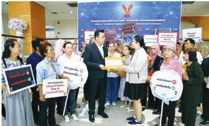
ท่วงประมุขคลื่น - สภาองค์กรของผู้บริโภคยื่นหนังสือคัดค้านการรับรองผลการประมุขคลื่นความถี่สำหรับกิจการโทรคมนาคมเคลื่อนที่สากลเนื่องจากเกรงว่าอาจส่งผลกระทบต่อผู้บริโภคในระยะยาว ที่ สำนักงาน กสทช.