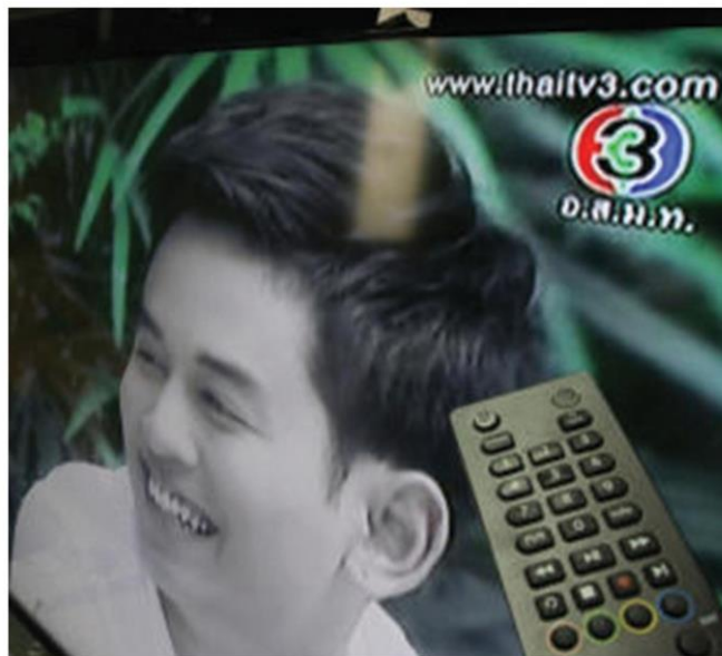
The must-carry rule requires cable operators to carry all 24 digital TV channels on their platforms.

Under the relief scheme, digital TV operators were given breathing space to survive by getting a delay for auction fee payments and a reduction of annual fees.