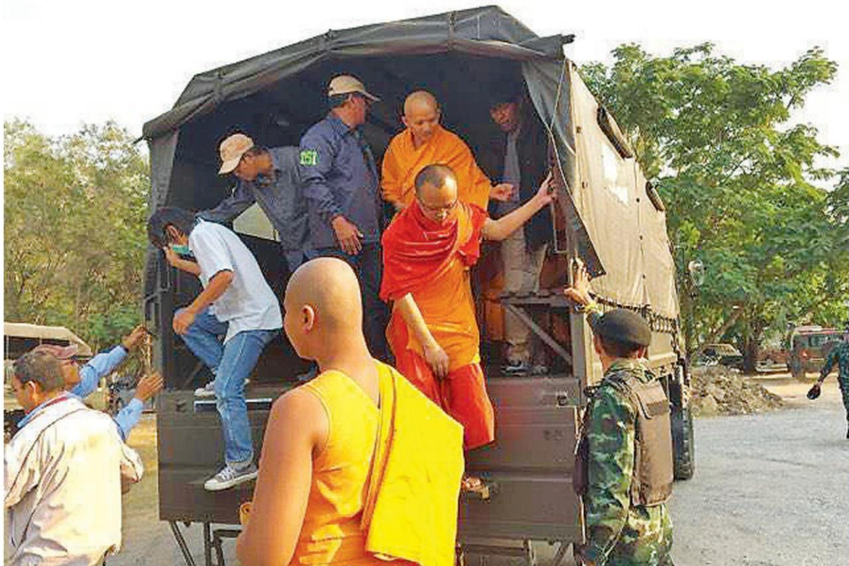
คุมตัว - เจ้าหน้าที่ดีเอสไอควบคุมตัวพระภิกษุสามเณร และคณะศิษย์วัดพระธรรมกายพร้อม อุปกรณ์ไปสอนปากคำ เนื่องจากยอมรับเตรียมขยายพื้นที่ชุมนุมจากตลาดกลางคลองหลวงที่เริ่ม คับแค้น ไปยังบริเวณหลังสำนักงานโครงการคลองหลวงเมืองใหม่ เมื่อวันที่ 3 มีนาคม

‘บ๊ิกตู’สั่ง‘ทบ.-ตร.’ตั้งหน่วยแพทย์ในพื้นที่ ‘ธรรมกาย’ แม่น้ำตานองรับศพพยาบาลสาว จัดพิธีที่พะเยา พี่ชายเชื่อน้องสาวคงไม่ตายถ้า วัดไม่ถูกล้อม ‘บ๊ิกเจียบ’ขอ‘ธัมมชโย’เลิกเสวย สุข เชื่อยังอยู่ในวัด จี้ออกมามอบตัว อย่าทำ คนนับพันเป็นทุกข์-บ้านเมืองวุ่นวาย ‘พระสนิท วงศ์’หวั่นถูกรวบตัว สั่ง‘พระมหาทศพร’แกล้ง แทน (อ่านต่อหน้า 3)