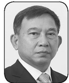
พล.อ.อ.ประจิน จั่นตอง

ไป ใครจะทำอะไรก็ได้จะ...● วันนี้คงไม่พูดถึงเรื่องการเมืองว่าด้วยกรณี 14 นักศึกษามากนัก เพราะเป็นการเดินตามรอยทันผู้นำ “พล.อ.ประยุทธ์ จันทร์โอชา” นายกา และหัวหน้า คสช. ที่บอกว่าจะขุดคุ้ยอะไรกันหนักหนา แต่ที่สำคัญคือ “สะอิดสะเอียน” กับบรรดาพวกที่ห้อยโหนเด็กๆ ทั้งหลายเพื่อสร้างราคาตัวเองด้วย เพราะถ้า แน่จริงบรรดาพวกที่มาร้องแหยกแหยกให้ท้ายนักศึกษาว่าทำถูกต้องตามหลักประชาธิปไตยในปัจจุบัน ทำไม่ไม่ออกมาหน้า เหล่านักศึกษาเล่า ไส้เรียงตั้งแต่ “วัฒนา เมืองสุข” “ณัฐวุฒิ ใสยเกื้อ” และบรรดาอาจารย์แห่งนิติเรดทั้งหลาย...● แล้ว “พล.อ.อ.ประจิน จั่นตอง” รมว. คมกาคม ก็เดินมาถูกทางกับเขาบ้างแล้ว ในการชะลอนุมัติการปรับขึ้นค่าโดยสารแท็กซี่ครั้งที่ 2 อีก 5% ไปก่อน 3 เดือน ทั้งที่ความจริงมันแก้ปัญหาผิดพลาดมาตั้งแต่ต้นในการอนุมัติขึ้นค่าโดยสารเพื่อแก้ปัญหาคุณภาพการให้บริการ เพราะเป็นคนละเรื่องเดียวกัน ซึ่งก็เห็นได้ชัดจากการประเมินผลของการขึ้นราคาครั้งแรกว่า มีแท็กซี่ยังไม่ผ่านเกณฑ์ที่กำหนด 75% โดยส่วนใหญ่คะแนนไม่ถึง 45-