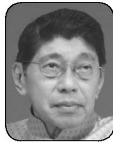
วิชณู เครืองาม

50% แหม! อยากให้ ท่านรัฐมนตรีลองไปเดินแถว “สยาม” และ “มานูญครอง” ช่วงเย็นถึงค่ำดูบ้างนะจ๊ะ คะแนนอาจติดลบด้วยซ้ำ เพราะแท็กซี่ไม่มีการกดมิเตอร์แทบทุกราย ซ้ำยังจอดกินเลน 2 ข้างถนนทั้งสามล้อและแท็กซี่ จนกลายเป็นแก๊งกันเลยทีเดียว...●