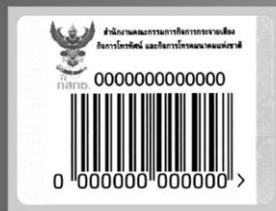
(สัญลักษณ์ครุฑแดง บาร์โค้ด กสทช.) (สัญลักษณ์ครุฑทอง กสทช.)