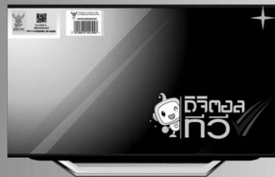
โทรทัศน์ระบบดิจิทัลทีวี (iDTV)