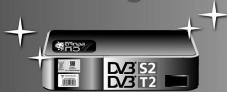
กล่องไฮบริดท์ รับสัญญาณดิจิทัลและดาวเทียม (DVB-T2 + DVB-S2)

สังเกตสัญลักษณ์ กสทช. ก่อนใช้คู่มือแลก/ซีอ