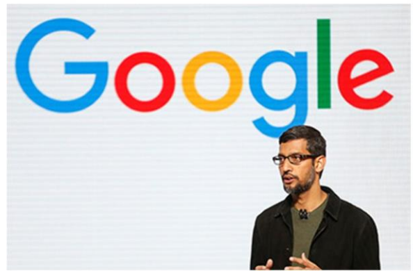
ซันดาร์ พิชัย ซีอีโอกูเกิล

12 มิถุนายน 2560 มีข่าวว่ากูเกิล (Google) และรัฐบาลอินโดนีเซียสามารถบรรลุข้อตกลงเรื่องภาษีแล้วเรียบร้อย โดยรัฐมนตรีว่าการกระทรวงการคลังแดนอิเหนาออกมายืนยันว่าเป็นข้อตกลงเรื่องมูลค่าภาษีที่กูเกิลต้องจ่ายสำหรับปีภาษี 2559 แต่ยังไม่ยอมเปิดเผยตัวเลขว่ามีมูลค่ากี่ล้านเหรียญสหรัฐ