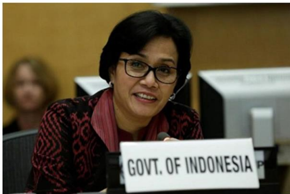
ศรีมุลยานี อินดราวัตี รัฐมนตรีว่าการกระทรวงการคลังอินโดนีเซีย