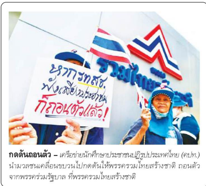
กอดันถอนตัว - เครือข่ายนักศึกษาประชาชนปฏิรูปประเทศไทย (คปท.) นำมวลชนเคลื่อนขบวนไปกอดันให้พรรคกรรมไทยสร้างชาติ ถอนตัวจากพรรคร่วมรัฐบาล ที่พรรคกรรมไทยสร้างชาติ