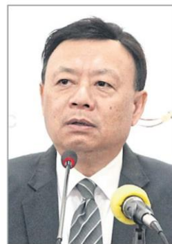
Takorn: Operators' mobile proposals weren't received

DTAC is the only major operator that failed to secure any licences in the 2015