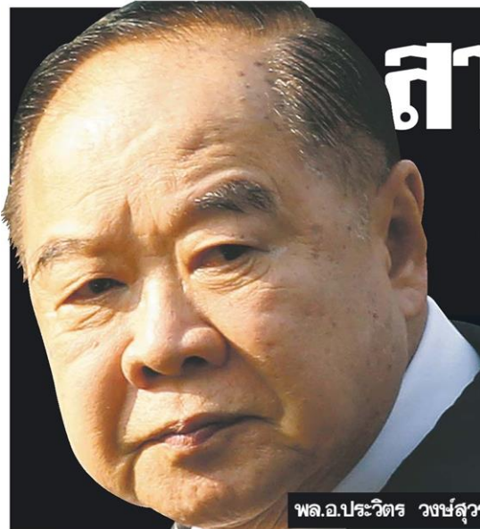
พล.อ.ประวิตร วงษ์สุวรรณ