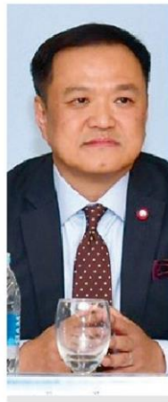
อนุทิน ชาญวีรกุล

พุดเอาดีใส่ตัวชั่วให้คนอื่น 'บิกตู' ปิดจับมือ 'เนวิน' สะพัด 9 ส.ส. 'โคราช' โดนดุด ให้ประกันวัฒนาคดีบ้านเอื้อ กสทช. ระงับ 4 รายการ พิษทีวี ภท.สวน 'คุณหญิงกัลยา-อิสสระ' เสียมารยาทวิจารณ์ 'เสียหนู' อัดทิ้ง กปปส.กลับ ปชป. (อ่านต่อหน้า 10)