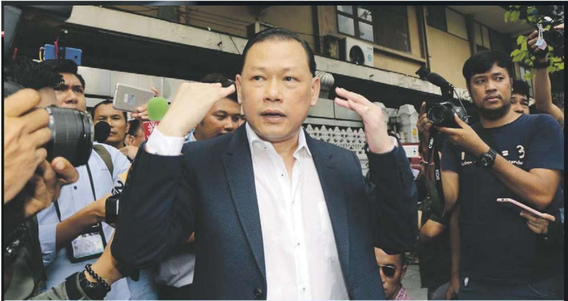
■ ขอพบนายกฯ ■ พ.ต.ท.สันธนะ ประยูรรัตน์ อดีตรองผู้กำกับการตำรวจสันติบาล ในฐานะประธานที่ปรึกษา บริษัท พัฒนาตลาดใหม่ดอนเมือง มาขอเข้าพบ พล.อ.ประยุทธ์ จันทร์โอชา นายกรัฐมนตรี ที่ทำเนียบรัฐบาล เพื่อแสดงความบริสุทธิ์ใจ เมื่อวันที่ 9 พ.ค.