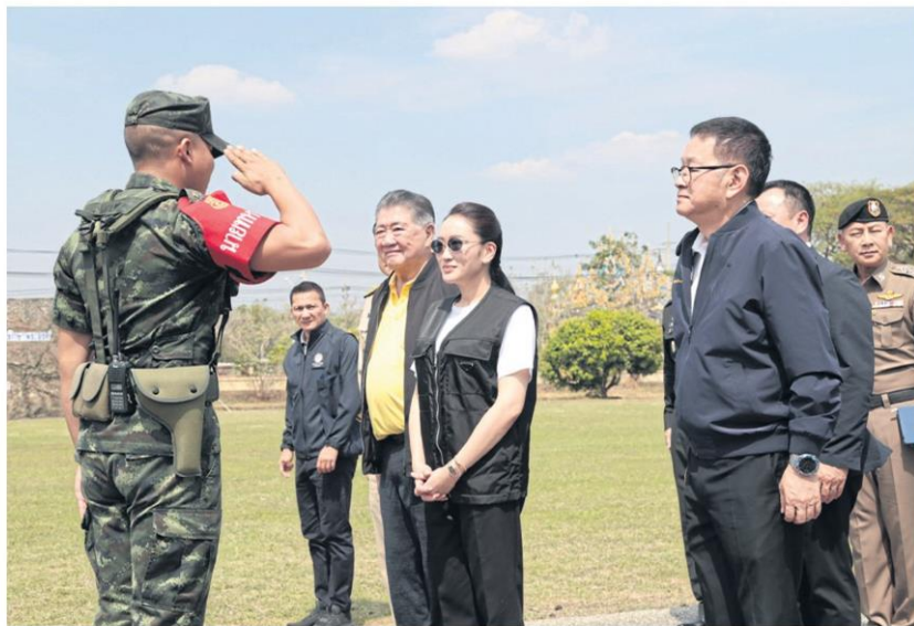
Prime Minister Paetongtarn Shinawatra arrives at the 3rd Infantry Battalion, 12th Infantry Regiment, King's Guard, for a meeting about the suppression of call centre scams during her visit to Sa Kaeo to follow up on the government's crackdown.

AIS and True Corporation representatives said they are implementing measures in the border provinces that are in line with NBTC instructions to assist with the crackdown efforts.