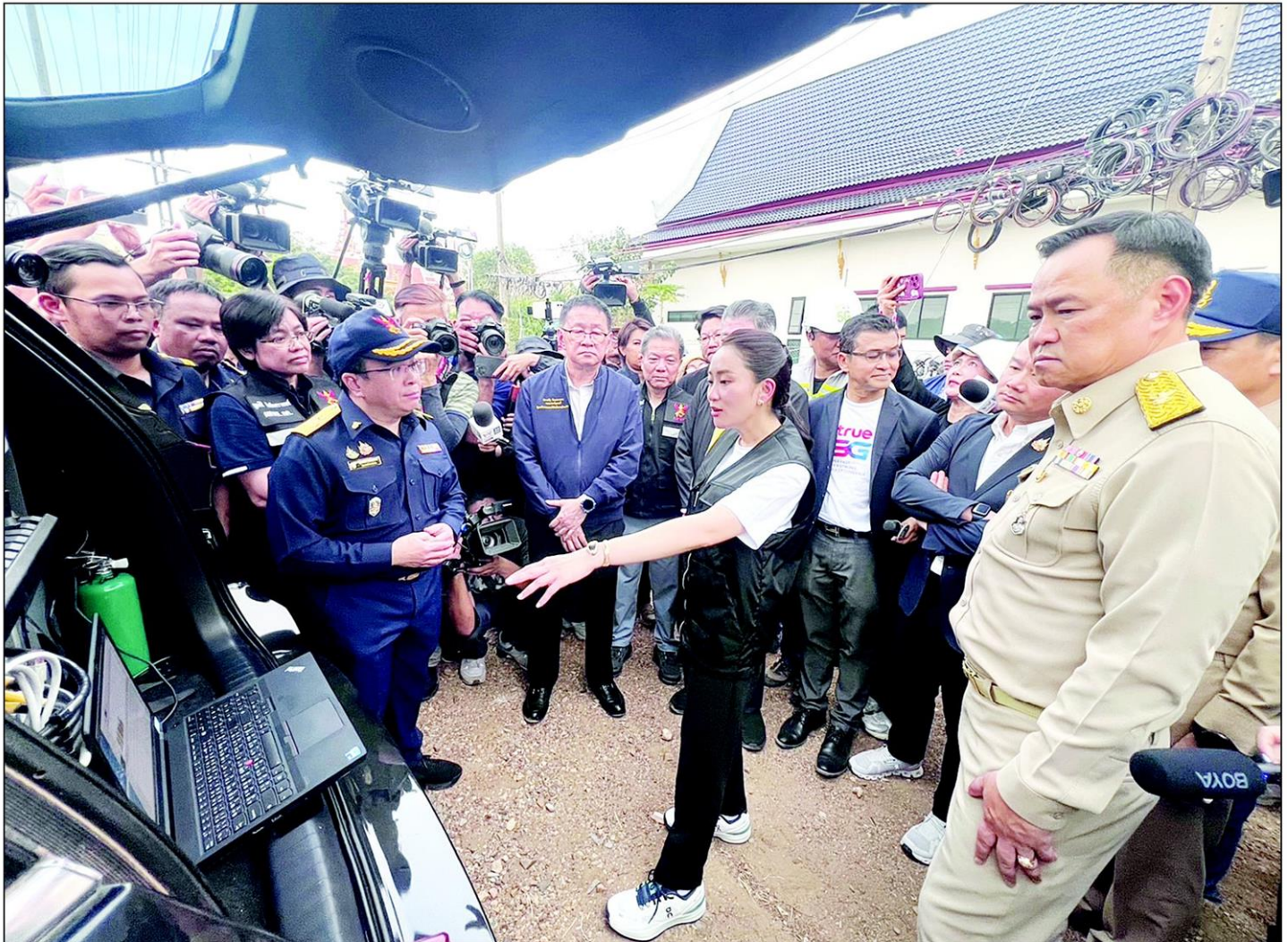
น.ส.แพทองธาร ชินวัตร นายกรัฐมนตรี พร้อมคณะ ติดตามการตัดสายสัญญาณการสื่อสารบริเวณด้านหลังสถานีรถไฟคลองลึก และการลดสัญญาณการสื่อสารที่ด่านพรมแดนบ้านคลองลึก ตำบลรัฐพรประเทศ อำเภอรัฐพรประเทศ จังหวัดสระแก้ว เมื่อวันที่ 28 ก.พ. 2568

ภายใน ร.12 พัน.3 รอ. โดยนายกฯ รับฟังบรรยายสรุปขั้นตอนการคัดกรอง พร้อม