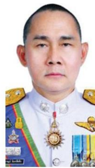
พล.ต.ต.เอกราษฎร์ อินทร์ดีเสิบ

โยง 'บ่อน-ฟอกเงิน' เมียวดี ภูมิธรรมบกกปอยเปตวันนี้ ล้นรู้ตัวแก๊งคอล-รูกกดดัน ทวิแย้มหมายจับ 'ซอชิตตู่' 'บิกต่าย' สั่งด่วน เด่ง 'ผู้การต๊ะ-ผบก.ตาก' เข้ากรู เช่นปมโยงธุรกิจสีเทาเมืองเมียวดี (อ่านต่อหน้า 14)