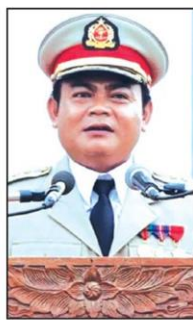
พ.อ.หม่องชิตตู่

ค้ำมนุษย์-โยงแก๊งคอลลา देंด่วน2นายตำรวจไทย เอี่ยว'เมียวดีคอมเพล็กซ์' 'บักอ้วน'โวแผนตัดไฟได้ผล