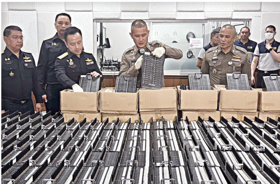
▲ ตัดวงจร...พล.ต.ท.จิรภพ ภูริเดช ผบช.ก. แถลงผลปฏิบัติการหลายจุดตั้ง Simbox และ STARLINK ตัดวงจรแก๊งคอลเซ็นเตอร์ ยึดของกลางได้จำนวนมากมโหฬารครั้งใหญ่ที่สุดในประวัติศาสตร์

เป้าหมายสำคัญจุดแรกอยู่ที่โกดัง แห่งหนึ่งในหมู่ 8 ต.ไผ่ดำ อ.หนองแ จ.สระบุรี หลังสืบทราบว่ามีพื้นที่ดังกล่าว เป็นฐานของเครือข่ายคอลเซ็นเตอร์ ซึ่ง ผลการเข้าตรวจค้นพบอุปกรณ์ซิมบ็อกซ์