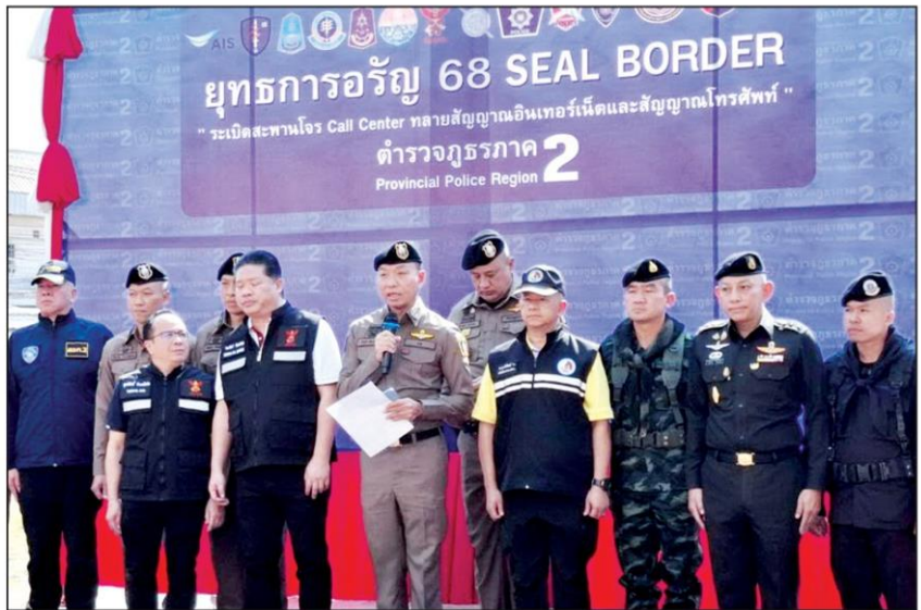
▲ ตัดสัญญาณเน็ต : พล.ต.ท.ยิ่งยศ เทพจำนงค์ ผบช.ภ.2 พร้อม กสทช.ร่วมแถลงเปิด "ยุทธการ อริย 68 Seal Border ระเบิดสะพานโจร Call Center ทลายสัญญาณอินเทอร์เน็ตและสัญญาณโทรศัพท์" ตัดเส้นเลือดใหญ่ขบวนการหลอกลวงออนไลน์ โดยร่วมกันตัดสัญญาณฯ ในจุดสำคัญบริเวณแนวชายแดน อ.อริยประเทศ จ.สระแก้ว

วันเดียวกัน DKBA ยังออกประกาศฉบับที่ 2/2568 มีเนื้อหาโดยสรุปว่า เนื่องจากไทยตัดกระแสไฟฟ้าและห้ามส่งออกน้ำมันเชื้อเพลิงไปอ.พญาตองซู ทำให้ประชาชนในพื้นที่เดือดร้อนมาก ดังนั้น เพื่อบรรเทาความเดือดร้อนของประชาชนและให้ไทยกลับมาส่งกระแสไฟฟ้าและอนุญาตให้นำเข้าน้ำมันเชื้อเพลิงอีกครั้ง DKBA จะเร่งแก้ปัญหาเรื่องนี้ โดยขอประกาศให้ชาวจีนที่เข้ามาทำธุรกิจเปิดร้านอาหาร ค้าขาย เปิดบ่อนกาสิโนและเกมออนไลน์อย่างผิดกฎหมายต้องเดินทางออกจากอ.พญาตองซูให้หมดภายในวันที่ 28 กุมภาพันธ์ หากฝ่าฝืนจะถูกดำเนินคดีตามกฎหมาย และจากนี้ จะเพิ่มมาตรการตรวจสอบ