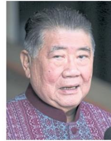
Phumtham: Wants cuts in more areas