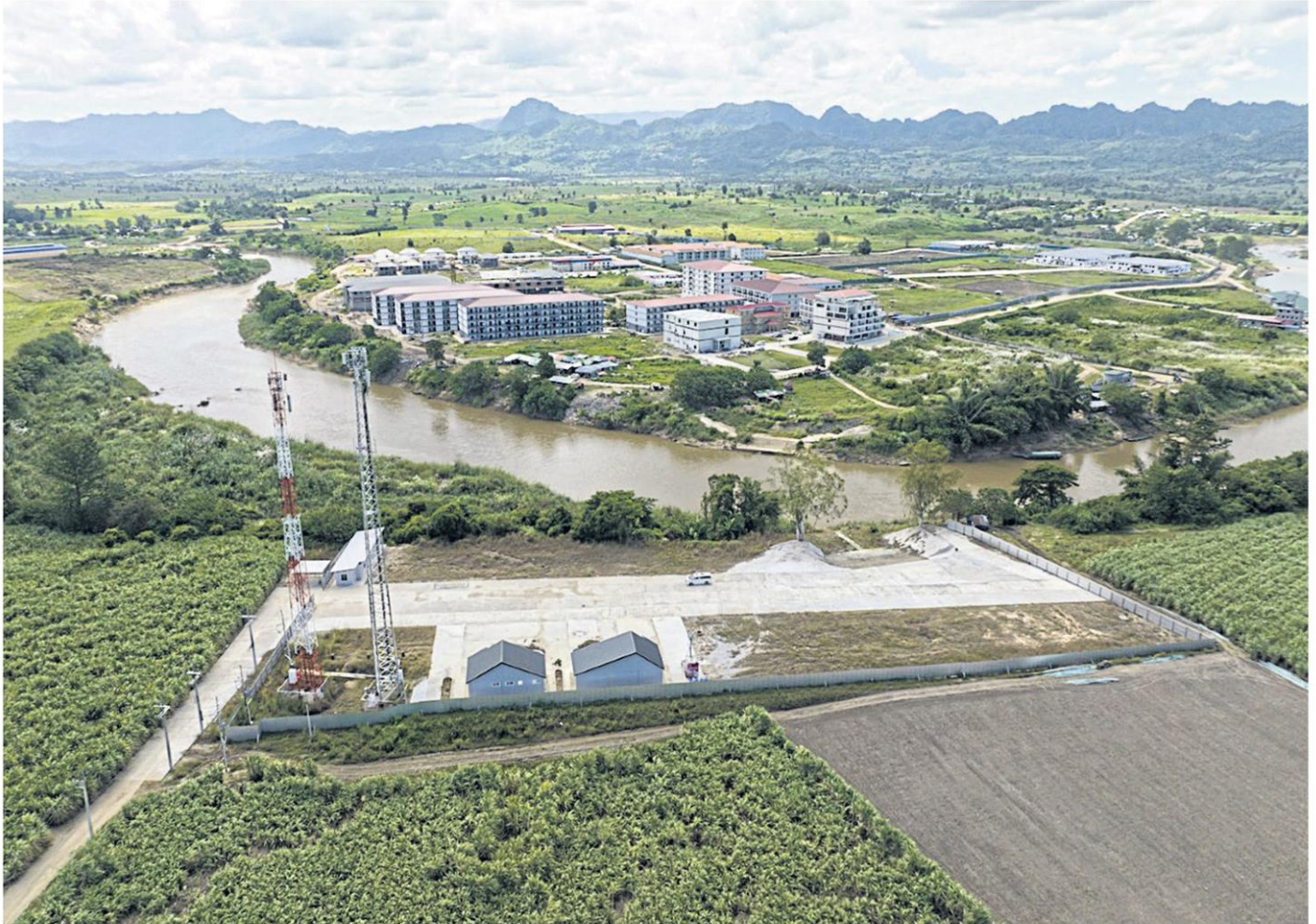
Myanmar's Myawaddy township is seen from Thailand's Mae Sot district in Tak province in 2022. Thai authorities cut electricity, oil, and some internet signals to the area last week after the government found that the utilities had been used by scammers and traffickers.