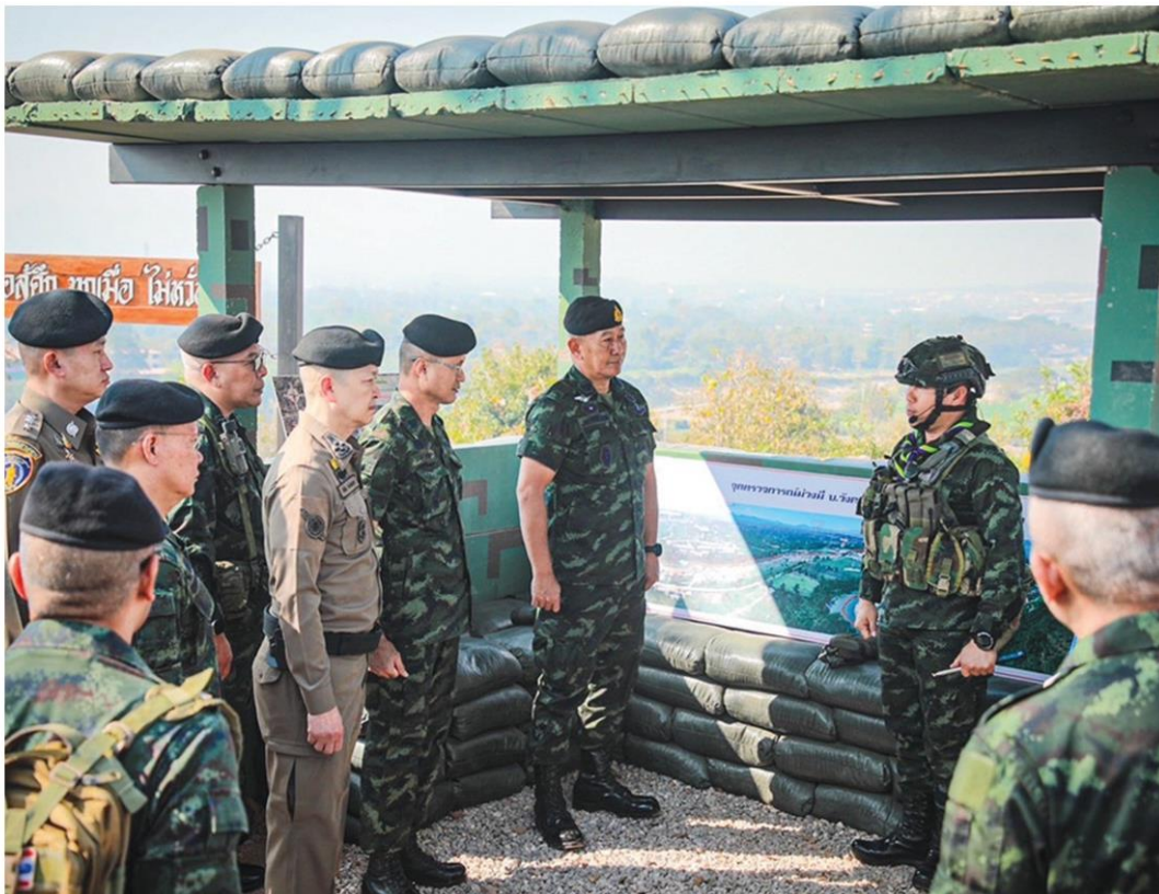
🏠 ซีลชายแดน - พล.อ.พนา แคล้วปลอดทุกข์ ผบ.ทบ. พล.ต.อ.ธัชชัย ปิตะนีละบุตร จเรตำรวจแห่งชาติ เดินทางไป ติดตามการคุมเข้มชายแดนอ.แม่สอด และอ.พบพระ จ.ตาก ตามมาตรการปราบแก๊งคอลล์-ยาเสพติด เมื่อวันที่ 10 ก.พ.

ที่บช.ภ. 5 พล.ต.ท.กฤษดาพล ยี่สาคร ผบช.ภ. 5 ชี้แจงกรณีตำรวจภูธรภาค 5 ชี้แจงกรณีปรากฏในข่าวและสื่อออนไลน์