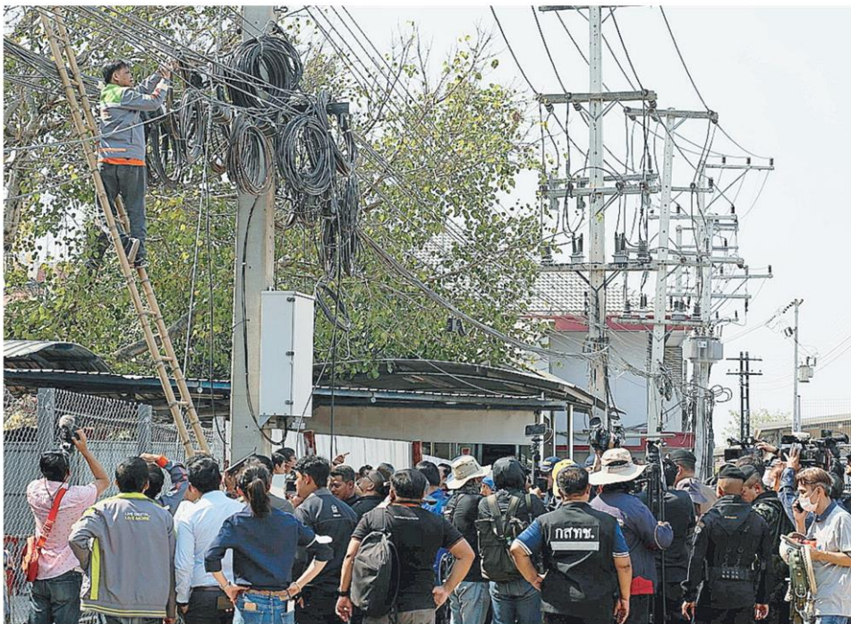
ตัดสายสื่อสาร เจ้าหน้าที่ กสทช.ลงมือตัดสัญญาณอินเทอร์เน็ตและทำลายสัญญาณโทรศัพท์ 3 จุด ในพื้นที่ชายแดน อ.รัฐประเศ จ.สระแก้ว ติดกับปอยเปต กัมพูชา เป็นการตัดเส้นทางแก๊งหลอกหลวงออนไลน์ใช้สัญญาณจากไทย.

ภายหลังจากที่รัฐบาลไทยตัดกระแสไฟฟ้า สัญญาณอินเทอร์เน็ต รวมถึงระงับการส่งน้ำมันเชื้อเพลิง 5 จุด ในประเทศเมียนมา ที่เมืองเมียวดี บริเวณริมชายแดนไทยติดกับอ.แม่สอด อ.พบพระ จ.ตาก และเมืองพญาทองซู ติดกับ อ.สังขละบุรี จ.กาญจนบุรี มาตั้งแต่วันที่ 5 ก.พ.ที่ผ่านมา เพื่อตัดช่องทางของกลุ่มจินเทาที่ตั้งแก๊งคอลเซ็นเตอร์ หลอกหลวงคนได้รับความเสียหายไปทั่วโลก และกดดันให้รัฐบาลเมียนมาปราบแก๊งคอลเซ็นเตอร์อย่างจริงจัง โดยตลอดวันที่ 10 ก.พ. ผู้สื่อข่าวรายงานว่ามีการพบบุคคลต่างชาติหลบหนีออกมาจากแก๊งคอลฯได้อีกที่ อ.พบพระ จ.ตาก พ.ต.อ.แมน รัตนประทีป รองผู้บังคับการตำรวจภูธรจังหวัดตาก รักษาการแทนผู้กำกับการสภ.พบพระเปิดเผยว่าเมื่อเช้าพบชาวเคนยา รายมาขอความช่วยเหลือจากชาวบ้าน หมู่ที่ 5 บ้านหมื่นฤกษ์ ต.พบพระ อ.พบพระ บริเวณใกล้เคียงกับที่พบนายเจมส์ โฟนุเด อะมุนกา ชาวเคนยา จึงพามาส่งให้ตำรวจ สภ.พบพระ เบื้องต้นทราบชื่อร้านายวิกเตอร์ นากิตารี อายุ 27 ปี ชาวเคนยา อ้างว่าถูกหลอกโดยเพื่อนชาวเคนยา ให้มาทำงานในไทย เป็น Customer manager เมื่อมาถึงไทยมีรถยนต์มารับข้ามชายแดน บังคับให้ทำงานให้เป็นสแกมเมอร์ จึงหลบหนีออกมา