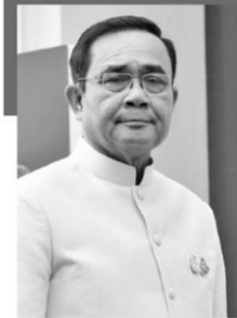
ประยุทธ์ จันทร์โอชา นายกฯ และ รมว. กลาใหม่

เมื่อวันที่ 10 ก.ค. พระบาทสมเด็จพระเจ้าอยู่หัว มีพระบรมราชโองการโปรดเกล้าฯ ให้ประกาศว่า ตามที่ได้ทรงพระกรุณาโปรดเกล้าฯ แต่งตั้ง พล.อ.ประยุทธ์ จันทร์โอชา เป็นนายกฯ ตามประกาศลงวันที่ 9 มิ.ย.2562 แล้วนั้น บัดนี้ พล.อ.ประยุทธ์ฯ ได้เลือกสรรผู้สมควรดำรงตำแหน่งรัฐมนตรีเพื่อบริหารราชการแผ่นดินสืบต่อไปแล้ว อาศัยอำนาจตามความในมาตรา 158 ของรัฐธรรมนูญแห่งราชอาณาจักรไทย จึงทรงพระกรุณาโปรดเกล้าฯ แต่งตั้งรัฐมนตรีรวม 36 คน ดังต่อไปนี้