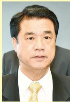
สุริยะ จึงรุ่งเรืองกิจ รมว.อุตสาหกรรม