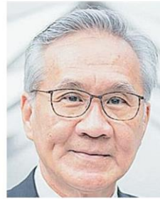
ดอน ปรมัตถ์วินัย

เชียร์และกองซัง อยู่ยาวมาหลายปีกว่าจะคืนความสุขจัดเลือกตั้งได้ก็เลื่อนแล้วเลื่อนอีกอยู่หลายรอบ และยังแปลงร่างจากกรรมการมาเป็นผู้เล่นยืนหล่อกเป็นแคนดิดเดตนายกฯ พรรคพลังประชารัฐ ได้รับเสียงโหวตท่วมท้นจาก ส.ส.-ส.ว.เป็น "นายกฯ 500" วีเทิร์นกลับมาเป็นผู้นำรอบสอง พร้อมอ้างความกล้าใจ รมว.กลาโหม แต่กว่าจะฟอร์มทีม ครม.ลงตัวก็ลากยาวไป 3 เดือนกว่าๆ รอพิสูจน์ฝีมือจะพาบ้านเรา "เรือเหล็ก" ที่กำลังปริ่มน้ำฝ่าพายุเหล่าเสือ สิงห์ กระทิง แรดไปได้ยาวนานแค่ไหน.