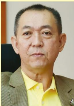
เฉลิมชัย ศรีอ่อน รมว.เกษตรฯ