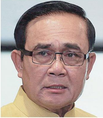
พล.อ.ประยุทธ์ จันทร์โอชา