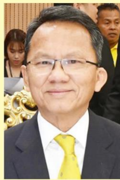
สมศักดิ์ เทพสุทิน รมว.ยุติธรรม