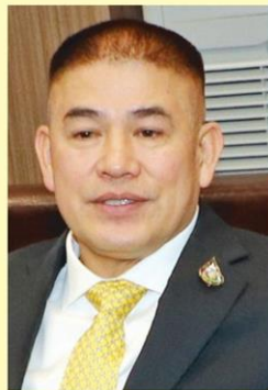
ธรรมนัส พรหมเผ่า รมช.เกษตรฯ