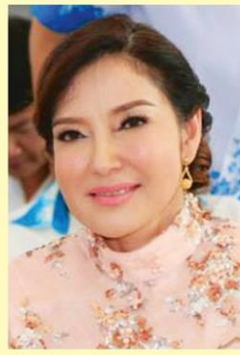
มนัญญา ไทยเศรษฐ์ รมช.เกษตรฯ