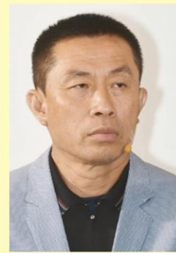
ศักดิ์สยาม ชิดชอบ รมว.คมนาคม