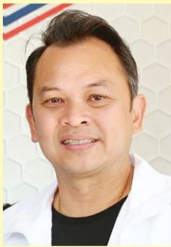
ณัฐพล ทีปสุวรรณ รมว.ศึกษาธิการ