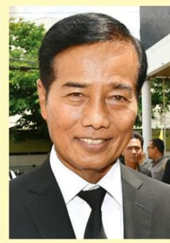
ถาวร เสนเนียม รมช.คมนาคม

ต่างประเทศ นายพิพัฒน์ รัชกิจประการ เป็น รมว.การท่องเที่ยวและกีฬา นายจุติ ไกรฤกษ์ เป็นรมว.การพัฒนาสังคมและความมั่นคงของ มนุษย์