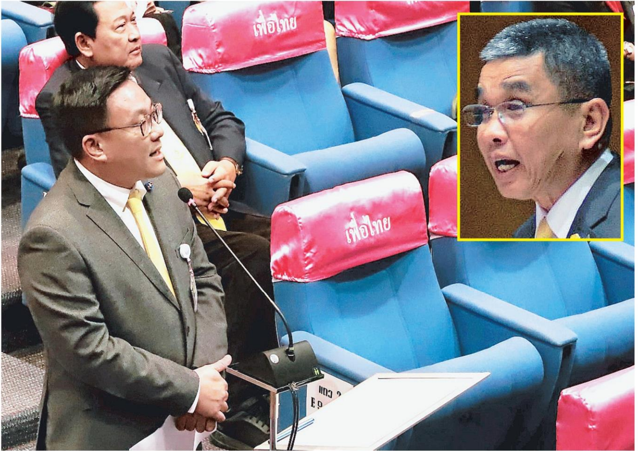
▲ ข้องใจเจ็ดหู นายจุลพันธ์ อมรวิวัฒน์ ส.ส. เชียงใหม่ พรรคเพื่อไทย ยินถามกระทรวงกลาโหมที่ประชุมสภาผู้แทนราษฎรถึงบขการจัดซื้อเครื่องบินเจ็ทรุ่น falcon 2000s ของสำนักงานตำรวจแห่งชาติ(สทช.) ที่ พล.อ. ประวิตร วงษ์สุวรรณ รองนายกรัฐมนตรี และ รมว. กลาโหม ใช้นั่งไปปฏิบัติภารกิจเมื่อสัปดาห์ก่อนอย่างถึงพริกถึงขิง.

บัดนี้ พล.อ. ประยุทธ์ จันทร์โอชา นายกรัฐมนตรี ได้เลือกสรรผู้ที่เหมาะสมดำรงตำแหน่งรัฐมนตรีเพื่อบริหารราชการแผ่นดินสืบไปแล้ว อาศัยอำนาจตามความในมาตรา 158 ของรัฐธรรมนูญแห่งราชอาณาจักรไทย จึงทรงพระกรุณาโปรดเกล้าฯ แต่งตั้งรัฐมนตรี ดังต่อไปนี้ พล.อ. ประวิตร วงษ์สุวรรณ เป็นรองนายกรัฐมนตรี นายสมคิด จาตุศรีพิทักษ์ เป็นรองนายกรัฐมนตรี นายวิษณุ เครืองาม เป็นรองนายกรัฐมนตรี นายจรินทร์ ลักษณวิศิษฏ์ เป็นรองนายกรัฐมนตรีและรัฐมนตรีว่าการกระทรวงพาณิชย์ นายอนุทิน ชาญวีรกูล เป็นรองนายกรัฐมนตรีและรัฐมนตรีว่าการกระทรวงสาธารณสุข นายเทวัญ ลิปตพัลลภ เป็นรัฐมนตรีประจำสำนักนายกรัฐมนตรี พล.อ. ประยุทธ์ จันทร์โอชา เป็นรัฐมนตรีว่าการกระทรวงกลาโหม อีกตำแหน่งหนึ่ง พล.อ. ชัยชาญ ช้างมงคล เป็นรัฐมนตรีช่วยว่าการกระทรวงกลาโหม