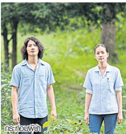
กระต้อมผีป่า

เทียน พระอาทิตย์อัสดง ไร่จันทร์แสงเดือน ลมหนาว ฆะตาชีวิต ยิ้มสู้ ฝัน รัก เตือนใจ แว่ว ไกล รุ่ง ยามค่ำ เราสู้ ยามเย็น สายฝน และในดวงใจนิรันดร์