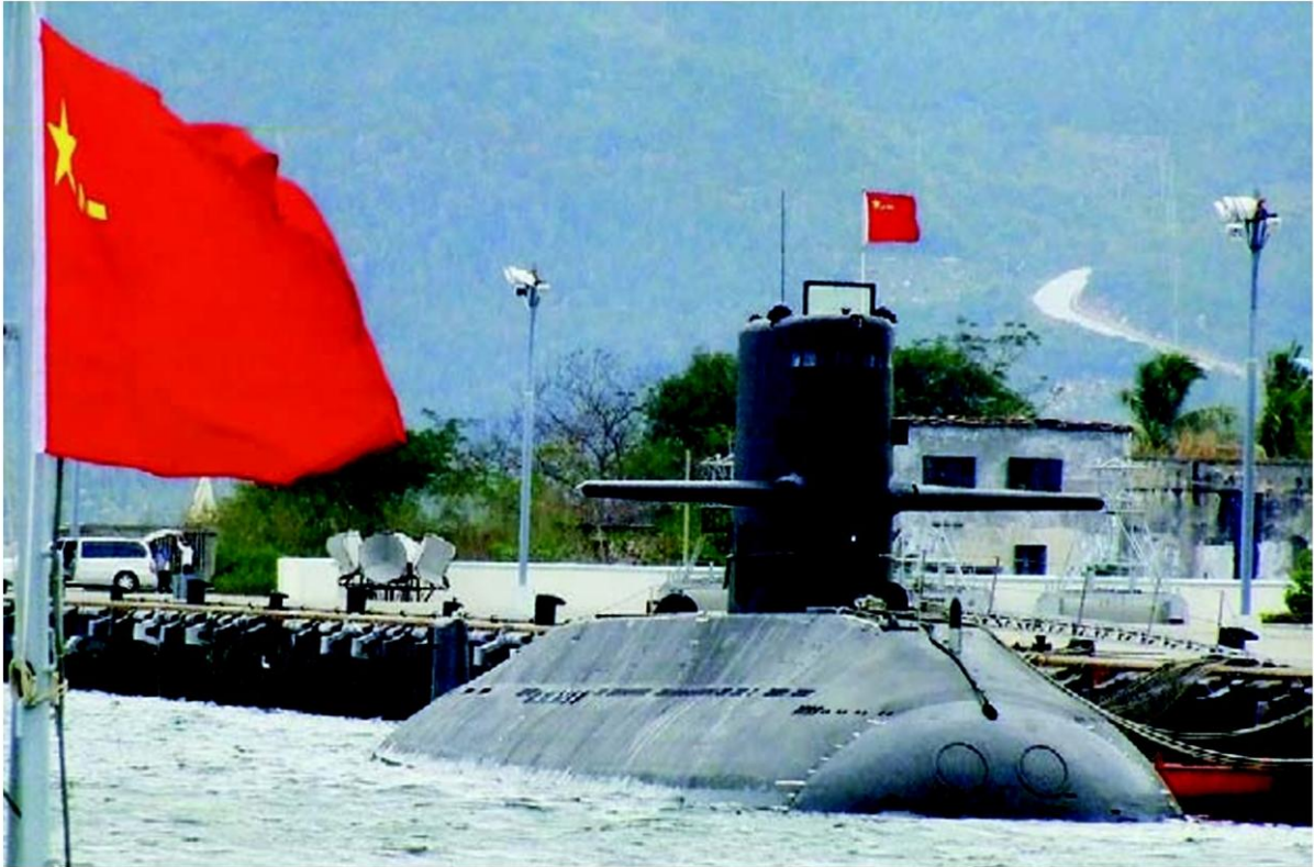
▲ เรือดำน้ำชั้นหยวนที่กองทัพเรือตกลงจะซื้อจากจีน

ขณะที่ พล.ร.อ. ไกรสรก็ได้ให้เหตุผลว่า ขณะนี้ประเทศเพื่อนบ้าน อาทิ เวียดนาม มาเลเซีย อินโดนีเซีย และสิงคโปร์ มีเรือดำน้ำเข้าประจำการมาหลายปีแล้ว ดังนั้น ไทยต้องสร้าง