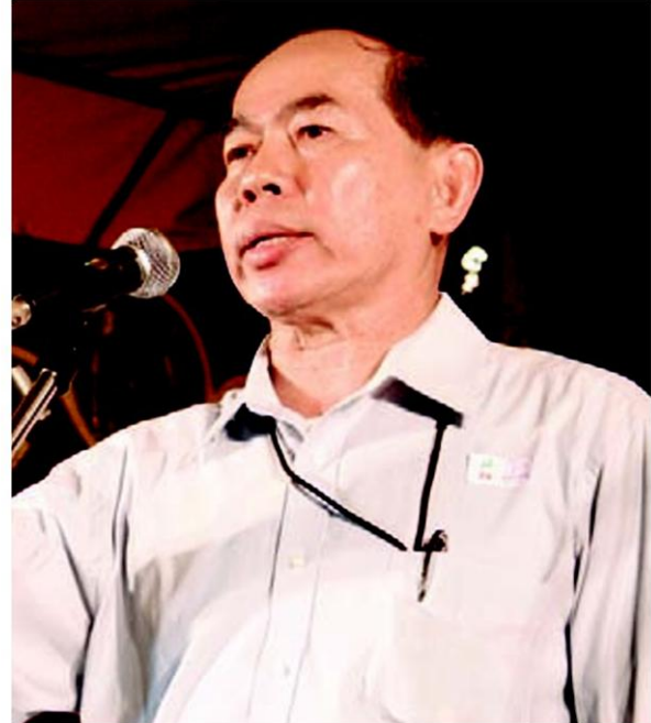
▲ พล.ร.ท. ประทีป ชื่นอารมณต์

จะพัฒนาเป็น "Blue Water Navy" หรือเป็นกำลังทางเรือเพื่อปฏิบัติการในทะเลลึก หมายถึงจะมีการปฏิบัติการทางเรือนอกอ่าวไทย หากเป็นเช่นนั้นก็สมควรที่จะมีเรือดำน้ำ เพื่อเป็นกำลังทางรุกไม่ใช่ทางรับ แต่อย่าลืมว่าเรากำลังจะเป็นประชาคมอาเซียน