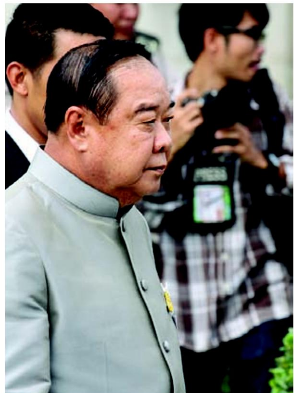
▲ พล.อ. ประวิตร วงษ์สุวรรณ รองนายกรัฐมนตรีและรัฐมนตรีว่าการกระทรวงกลาโหม

ทั้งนี้ หากพิจารณาในแง่ความจำเป็น ด้วยภูมิประเทศของไทยที่มีทะเลลึกสำคัญขนานข้างทั้งอ่าวไทย และอันดามัน ก็ต้องบอกว่า ความมั่นคงเขตแดนทางทะเล มีไม่น้อยไปกว่าบริเวณชายแดนแผ่นดินที่ติดกับประเทศไทย โดยเฉพาะอย่างยิ่งเป็นที่รู้กันว่า ทหารบกทางธรรมชาติในอ่าวไทยมีมหาศาลเพียงใด