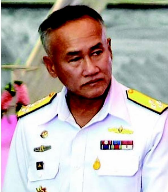
▲ พล.ร.อ. ไกรสร จันทรสุวานิชย์ ผู้บัญชาการทหารเรือ (ผบ.ทร.)