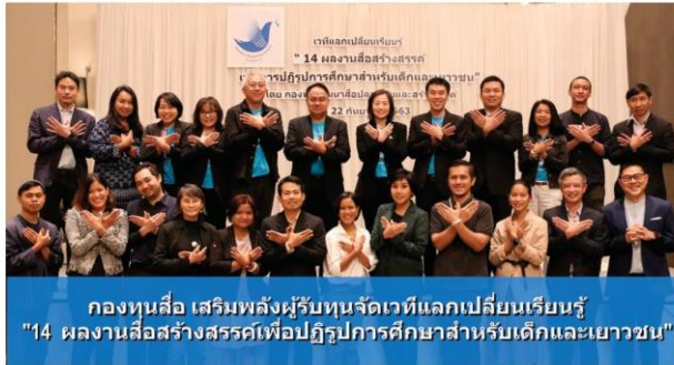
กองทุนสื่อ เสริมพลังผู้รับทุนจัดเวทีแลกเปลี่ยนเรียนรู้ "14 ผลงานสื่อสร้างสรรค์เพื่อปฏิรูปการศึกษาสำหรับเด็กและเยาวชน"

ทั้งนี้ให้คณะกรรมการมีอำนาจและหน้าที่ในการเสนอนโยบาย ยุทธศาสตร์ และมาตรการในการดำเนินงานด้านพัฒนาสื่อปลอดภัยและสร้างสรรค์ต่อคณะรัฐมนตรี และดำเนินการพัฒนาสื่อปลอดภัยและสร้างสรรค์ตามที่คณะรัฐมนตรีหรือนายกรัฐมนตรีมอบหมาย