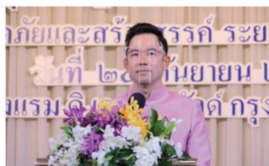
นายอิทธิพล คุณปลื้ม รัฐมนตรีว่าการกระทรวงวัฒนธรรม