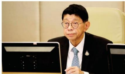
นายวิษณุ เครืองาม รองนายกรัฐมนตรี

โดยผู้ทรงคุณวุฒิจำนวน 9 คน นั้น นายกรัฐมนตรี แต่งตั้งจากบุคคลซึ่งมีความรู้ความสามารถ มีผลงานหรือประสบการณ์ ด้านสื่อสารมวลชน ด้านการศึกษา ด้านการบริหาร ด้านพัฒนาชุมชน ด้านกฎหมาย ด้านเศรษฐศาสตร์ ด้านโทรคมนาคม ด้านจิตวิทยา และด้านองค์กรพัฒนาเอกชน เป็นกรรมการ