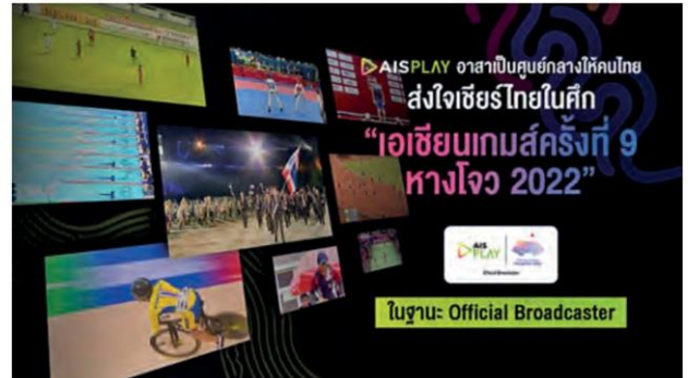
เชียร์นักกีฬาไทยปลายเดือนกันยายนถึงต้นเดือนตุลาคม

กีฬาเอเชียนเกมส์ครั้งนี้ ถือเป็นโอกาสเปิดมิติใหม่ของการถ่ายทอดสดคอนเทนต์ระดับชาติ อย่างมหกรรมการแข่งขันกีฬาระดับสากล เพราะ AIS ในฐานะผู้ถือสิทธิ์การถ่ายทอดสดอย่างเป็นทางการ หรือ Official Broadcaster รายเดียวในไทยสำหรับ IPTV และ OTT ยินดีเปิดกว้างส่งต่อสิทธิ์การถ่ายทอดสดผ่านช่องทางทีวีดิจิทัลที่จะหมุนเวียนกันถ่ายทอดผ่านกล่อง หรือรูปแบบอื่นใดที่ได้รับใบอนุญาตภายใต้บริการ IPTV จาก กสทช.