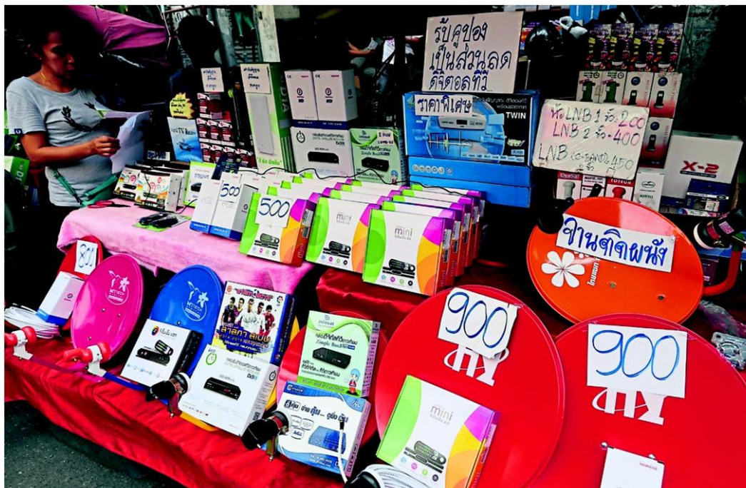
Digital set-top boxes eligible for the 690-baht subsidy are popular items at the Ban Mo electronics market in Bangkok.

The NBTC said the coupons had a six-month validity and would be sent to homeowners based on house registrations with the Interior Ministry. Coupons can be used to buy either a digital set-top box or a smart TV with a built-in digital antenna.