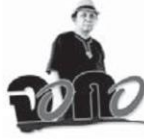
Chairman NPCT facebook/twitter\chakkrish

รับชวนไปให้ความรู้ และให้กำลังใจการรวมกลุ่มของวิทยุชุมชน ตามมาตรา 39 แห่งพระราชบัญญัติการประกอบกิจการกระจายเสียงและกิจการโทรทัศน์ ซึ่งมีเป้าหมายในการกำกับดูแลตนเอง หรือกำกับดูแลร่วมของผู้ประกอบวิชาชีพ โดยมีสำนักงานคณะกรรมการกิจการกระจายเสียง กิจการโทรทัศน์ และกิจการโทรคมนาคมแห่งชาติ (กสทช.) เป็นแม่ข่าย