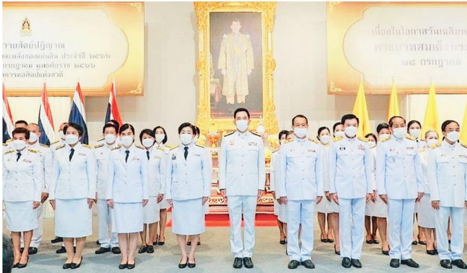
นายอิทธิพล คุณปลื้ม รมว.วัฒนธรรม และ นางยุพา ทวีวัฒนะกิจบวร ปลัดกระทรวง ร่วมพิธีถวายสัตย์ปฏิญาณเป็นข้าราชการที่ดีและพลังของแผ่นดิน ในวันเฉลิมพระชนมพรรษา ที่หอศิลป์แห่งชาติ.