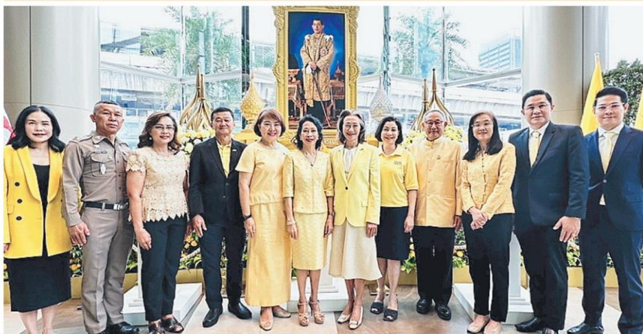
คณะผู้บริหาร กลุ่มสยามทิวรรจน์ และผู้บริหารสยามพารากอน พร้อมด้วยพันธมิตร ร้านค้าผู้เช่า ร่วมทำบุญถวายเป็นพระราชกุศล และถวายพระพร พระบาทสมเด็จพระเจ้าอยู่หัว ที่สยามพารากอน.