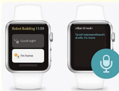
แอปพลิเคชัน Homekit บน สมาร์ต วอตช์

วิจัย “การออกแบบและพัฒนารูปแบบการเชื่อมต่อเครือข่ายแบบไร้สายภายในบ้านอัจฉริยะสำหรับผู้สูงอายุ” ซึ่งได้รับการสนับสนุนจาก กองทุนวิจัยและพัฒนาโครงการกระจายเสียง กิจกรรมโทรทัศน์ และกิจกรรมโทรคมนาคม เพื่อประโยชน์สาธารณะ (กทปส.) ซึ่งอยู่ภายใต้การกำกับดูแลของสำนักงานคณะกรรมการกิจการกระจายเสียง กิจการโทรทัศน์ และกิจการโทรคมนาคมแห่งชาติ (สำนักงาน กสทช.)