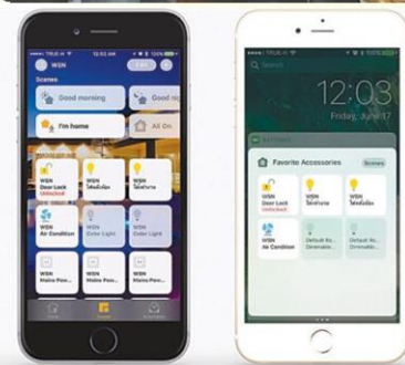
แอปพลิเคชัน Homekit บนสมาร์ตโฟน